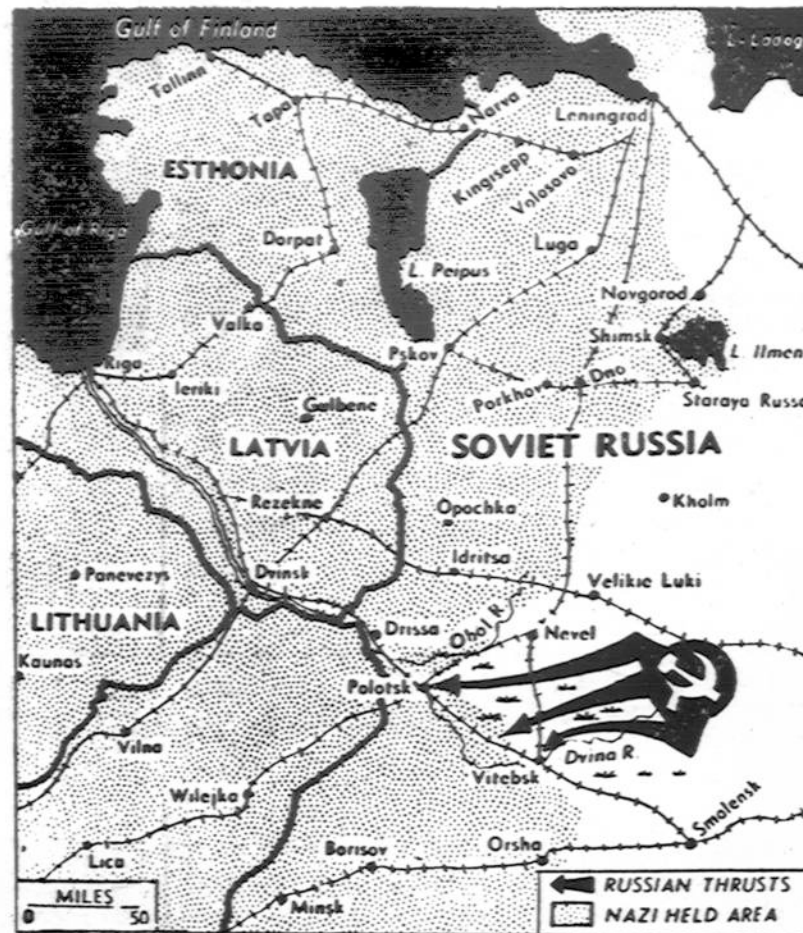
RUSAI STUMIA VOKIEČIUS IKI PABALTIJŲ

Sov. Rusijos pirmoji Pabaltijo armija, prieš pora dienų, naujausiais pranešimais, buvo tikrai už 12 mylių nuo Vitebsko ir už 20 mylių nuo Polotsko. Šiandien frontas jau bus vienaip, ar kitaip pasikeitęs.