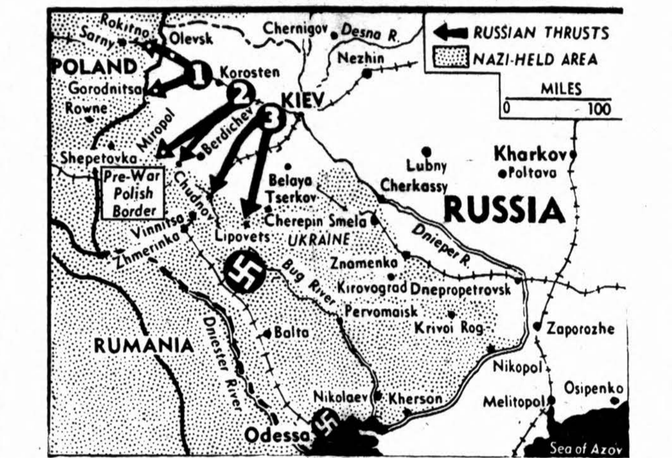
Žemėlapis atvaizduoja, kuriose vietose rusai veržiasi Lenkijon ir arčiau Rumunijos sienos.