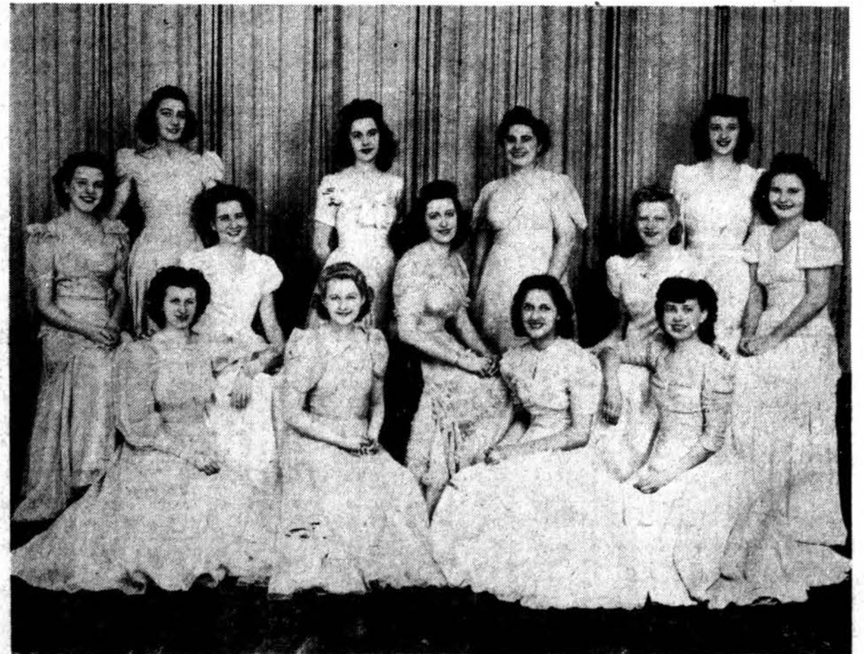
BRIGHTON PARK SODALIEČIŲ CHORAS

SV. KAZIMIERO AKADEMIJOS PRYZINIS ORKESTRAS