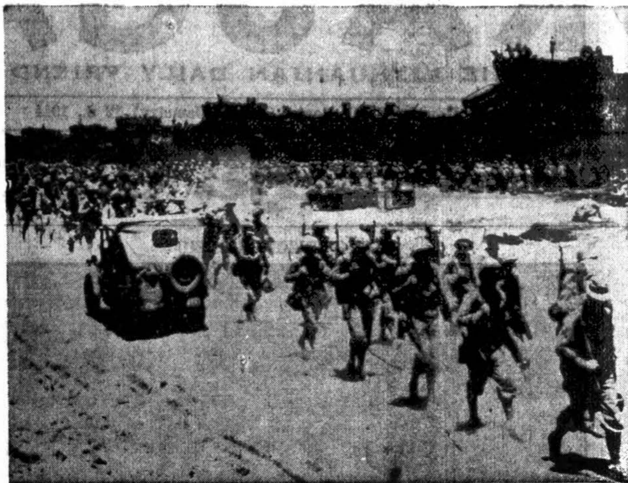
Amerikos kariuomenė išlaipinama ir pabūkliai iškeliama Cape Gloucester, New Britaine, iš kurios japonai išmušti ir dabar marinai jau nuėję keletą mylių arčiau kitų japonų pozicijų, kad pradėjus puolimą.

moga, kurioj Santa Claus vaidino Ambrasienė. Be to, pramogėles turėjo Gildas (Old Colony Inn), Marijos Vaikeliai ir k.