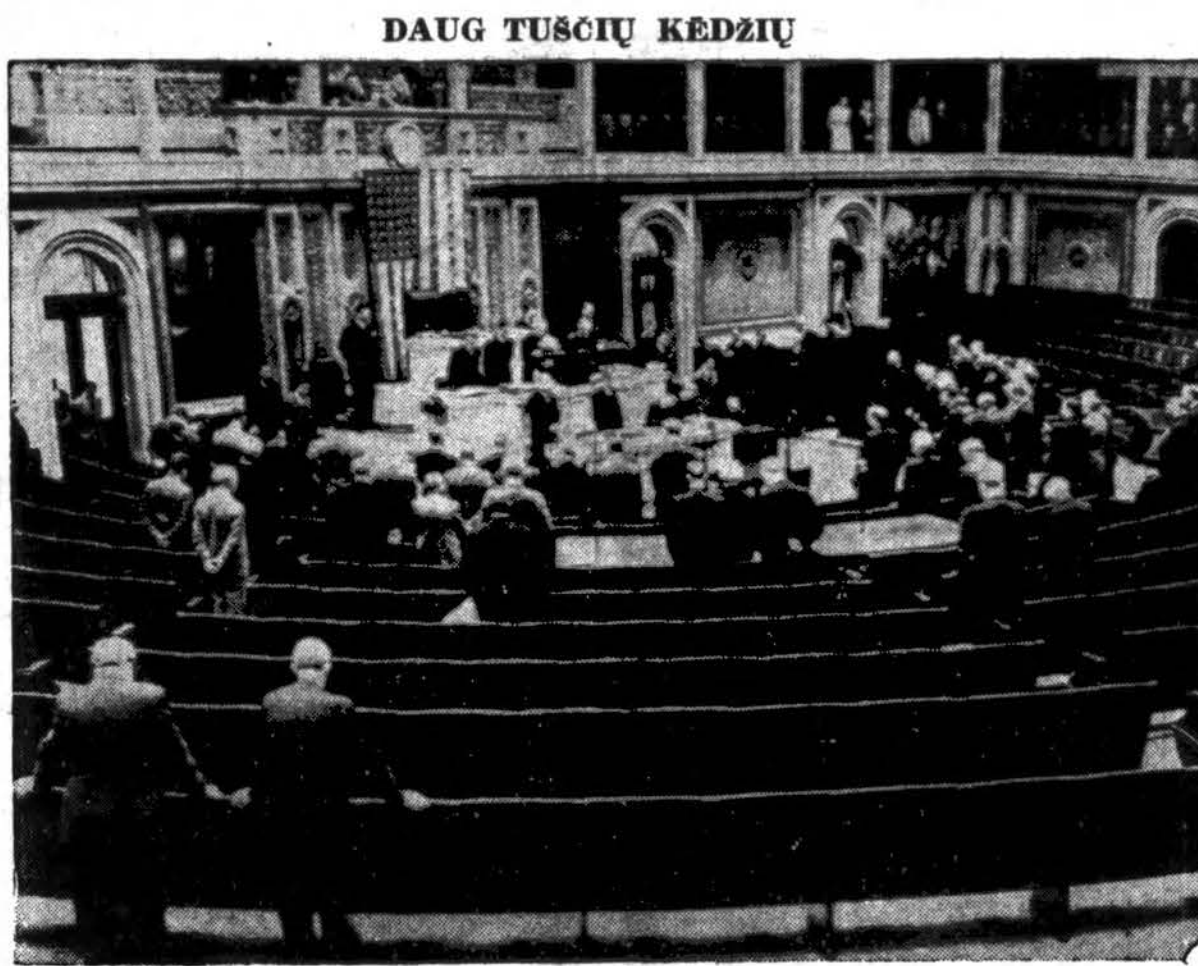
DAUG TUŠČIŲ KEDZIŲ