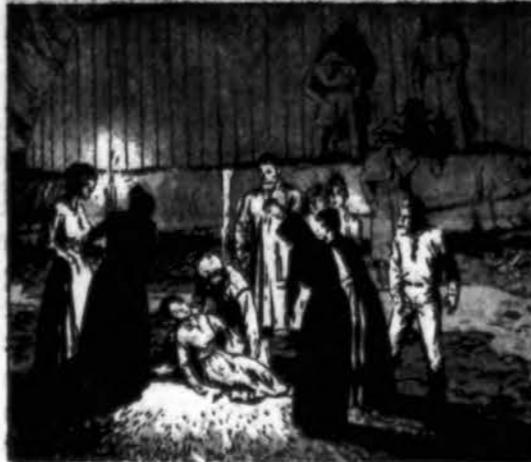
Antanas paėmė ją į rankas...