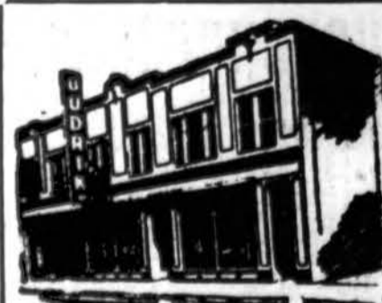
Budriko Moderniška Krautuvis

Ann Arbor, Mich. — Trys vyrai žuvo pereitą pirmadienį, kai Michigan Central traukinys palietė trokš, netoli Chelsea.