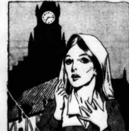
Bernadeta pajuto jausmą...