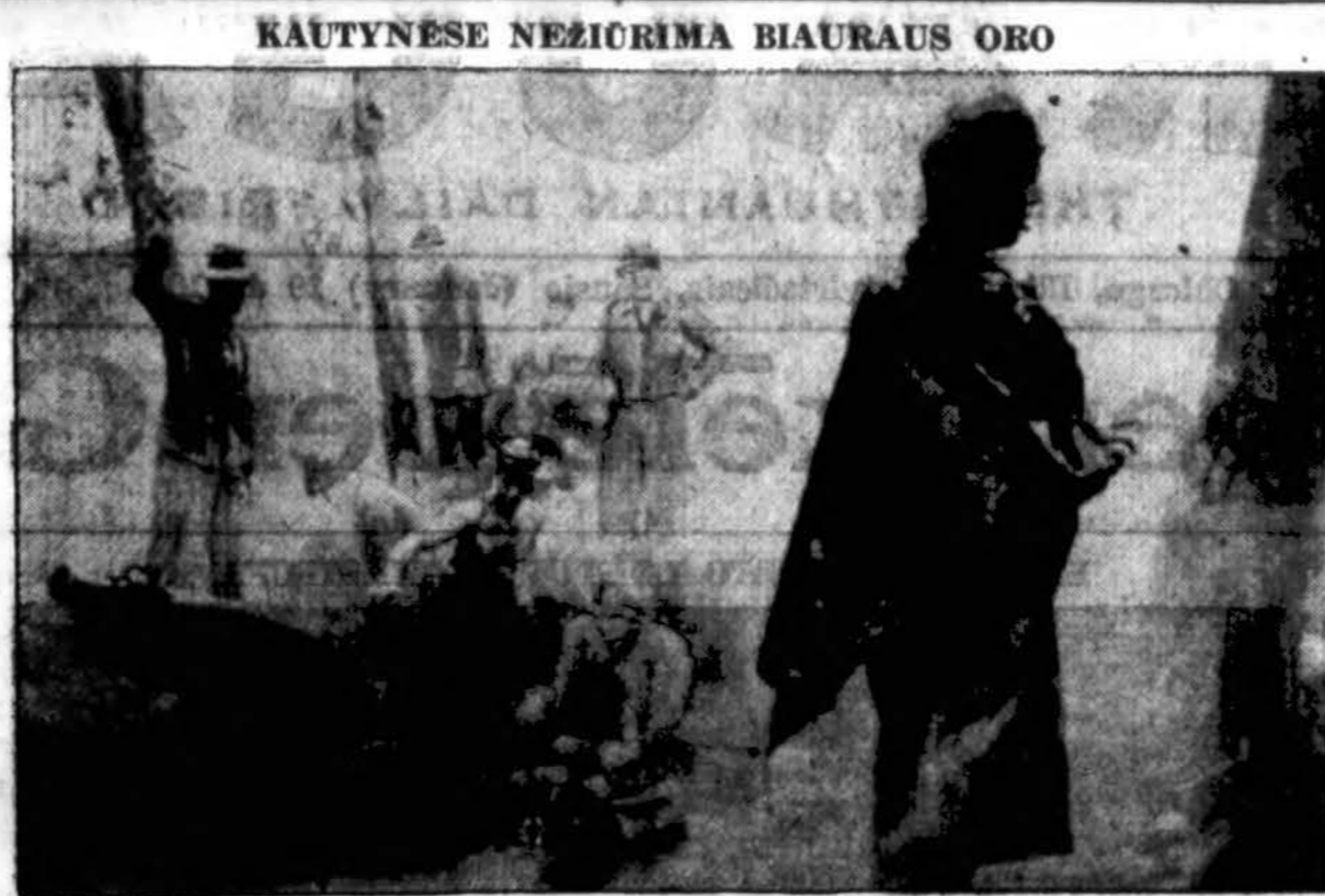
Nuotrauka iš kaulynių už Cape Gloucester, New Britaine. Nežūrint tropiško čiurkšlėmis lietaus kritimo, marinai-artileristai kanuolėmis griaua japonų įsistiprinimus. Tik tokiu super-didvyriškumu mūsų kariuomenė išmuša japonus iš anksčiau jų pagrobtų salų.