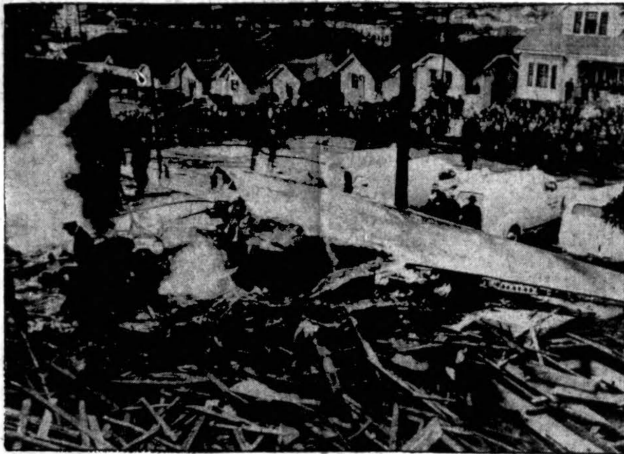
Aštuoni asmenys žuvo, kuomet karo transporto lėktuvas, skrisdamas virš Oakland, Calif., smogė į vieną namą. Ne tik šis namas nukentėjo, bet buvo padegti ir kiti šalia esantieji namai.