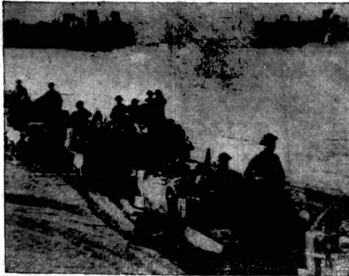
Bren sunkvežimiai, kuriais važiuoja britai kareiviai dalyvauja naujoj sąjungininkų invazijoje už vokiečių linijų tik į pietus nuo Romos, išvažiuoja nuo kranto, kur jie buvo iškelti, užimti savo pozicijas.