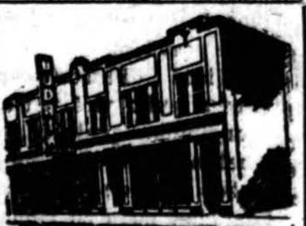
Budrio Moderniška Krautuė