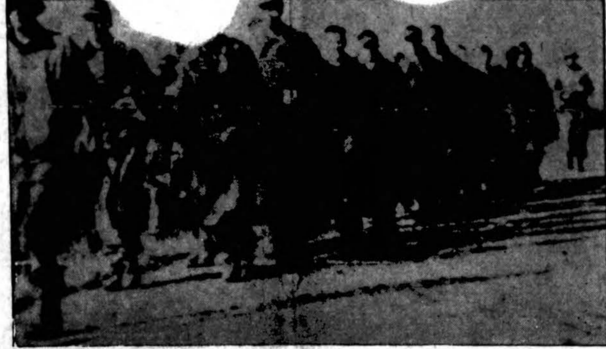
Eilės vokiečių belaisvių vedamos fronto užpakalin amerikiečių kareivių, kurie dalyvauja naujuose sąjungininkų žygiuose, po išlipimo už priešo linijų. Amerikiečiai, britai ir prancūzai kareiviai sakoma dar nesutiko didesnės opozicijos savo žygiavime į Romą.