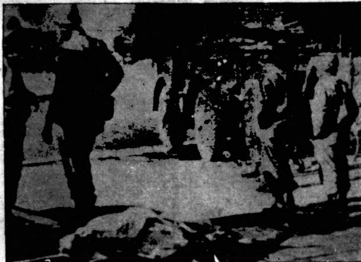
Amerikos kareiviai, užėmę jūros pakraštę pietvakaruose nuo Romos, prieš žygiuo- siant toliau, laidoja mūšiuose kritusius vokiečių kareivius.