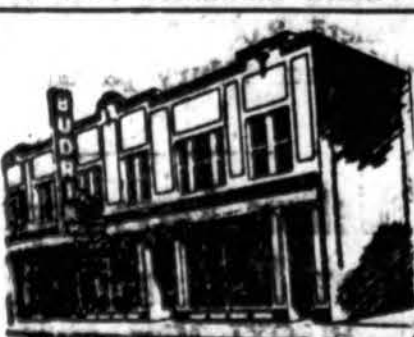
Budriko Moderniška Krantuvė