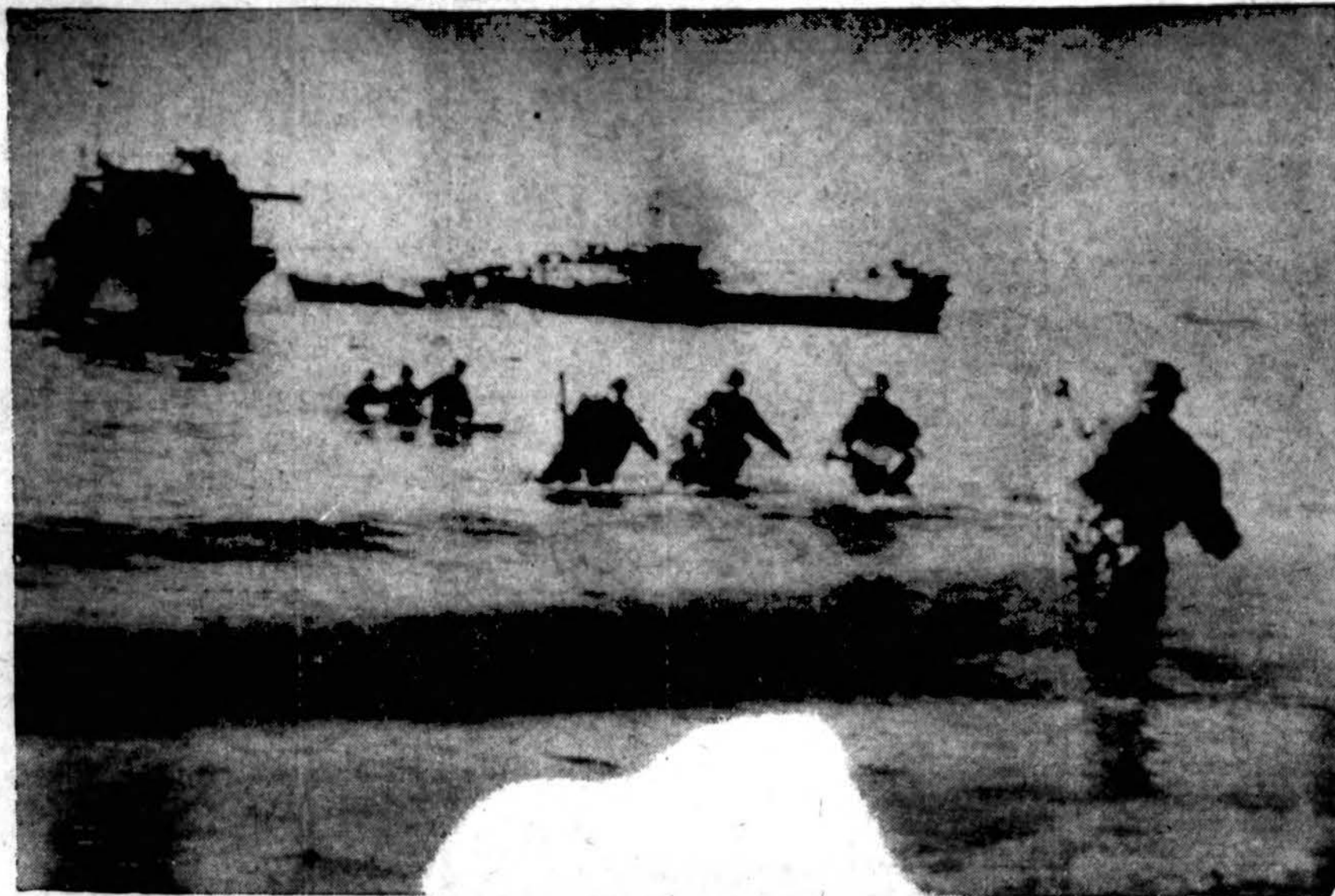
Pirmoji nuotrauka iš amerikiečių, britų ir prancūzų invazijos Italijon načių užnugaryje, prie Tiber upės įtakos, tik 16 mylių nuo Romos. Tolumoje Amerikos karo laivai, privežę arti krašto kariuomenę, o arčiau mažais laiveliais kariuomenė išlaipinama ant kranto ir iškeliami karo pabūklai.