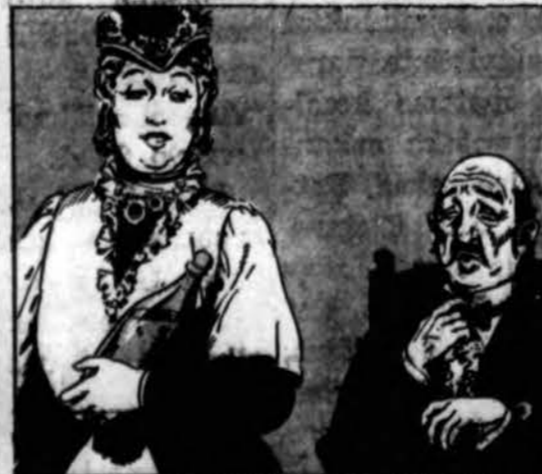
Policija atvedė ponią