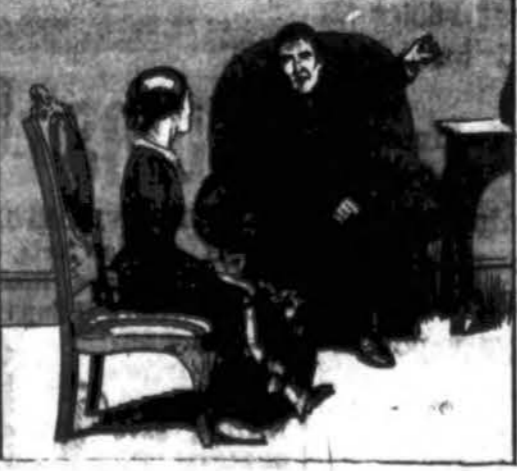
Bernadeta pašaukta į kleboniją