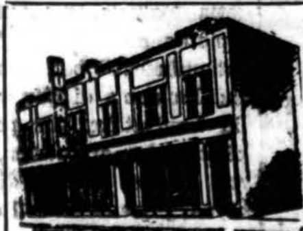
Budriko Moderniška Krautuovė

Vatos sėkla, dabar svarbi medžiaga daugelio produkcijoje, buvo laikoma nereikšmingu produktu prieš civilį karą.