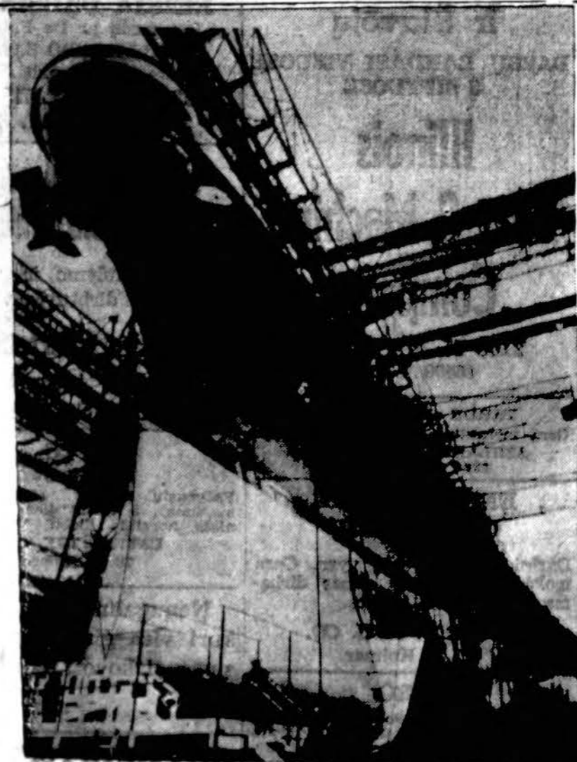
Didžiausias pasauly karą laivas Missouri šiomis dienomis nuleistas į vandenį Brooklyno laivų dirbtuvėse. Laivo įginklavimas ir greitis laikomas slapybėje.