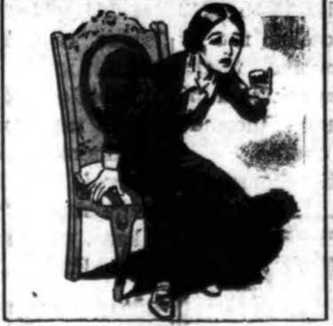
Mirtinai išblyškus, ji pašoko...