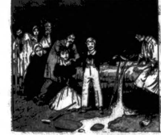
Šimtai ligonių išgijo prie šaltinio