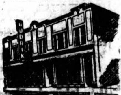
Budriko Moderniška Krautuė

(LKFSB) Nacių, norėdami Baltijos tautas sukirti į vieną prieš kitą, mėgsta į kaimyninį karštą nugabenti kitos tautos vyrus, kad jų rankomis atliktinėtų savo tamsius darbelius. Kaip praneša slaptasis Lietuvos laikraštis "Laisvė", pereinamąją vasarą į Lietuvą buvo atgabenta keliasdešimt latvių policininkų, neva kad jie Lietuvos miškuose sugaudytų "banditus." Latviai, tačiau, atsisakė, pamatę, kad vokiečiai bandytais vadina mobilizacijon nestojusį jaunimą. Esą, ir Latvijoje tokių pilni miškai.