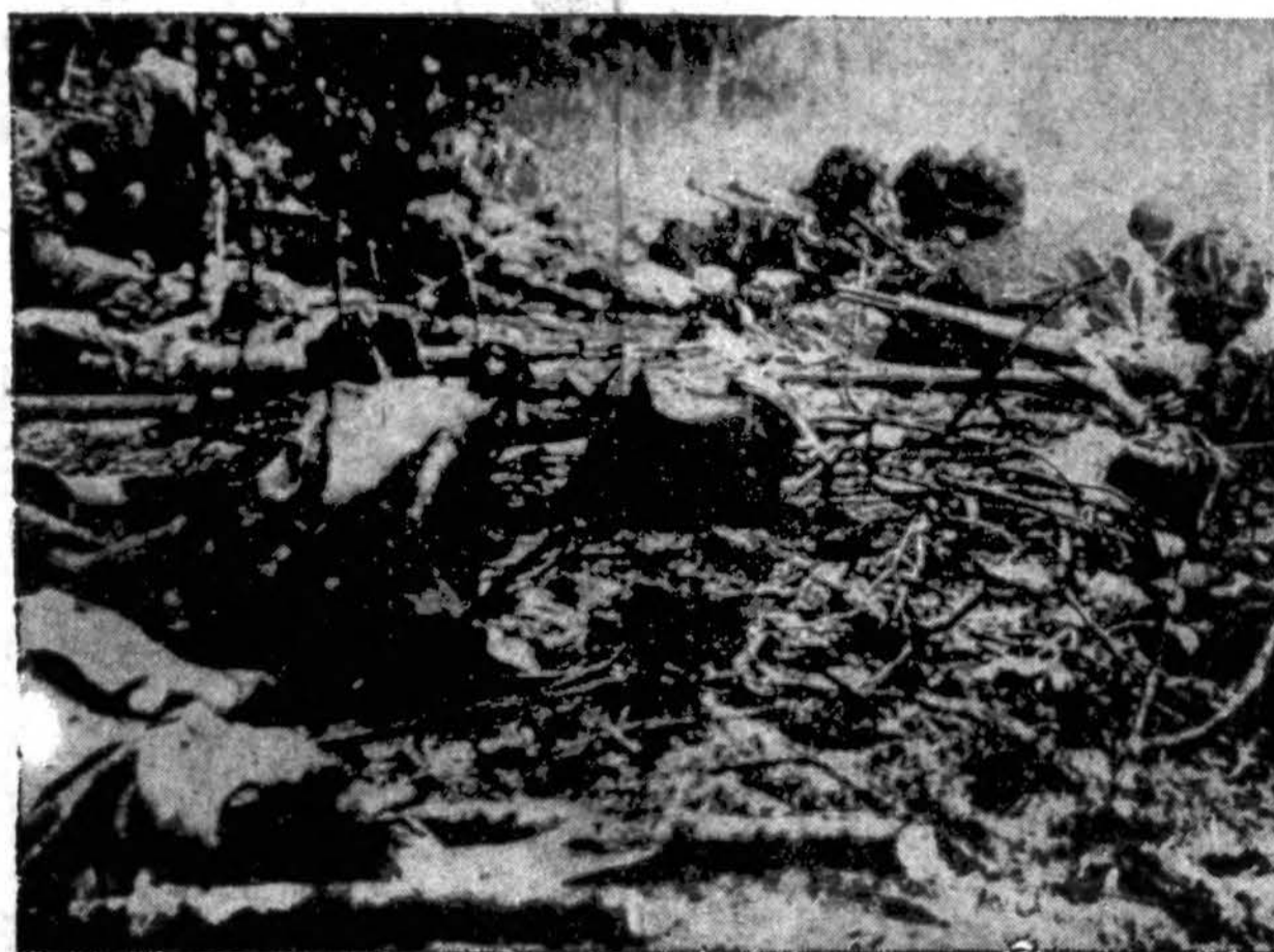
Benešant suzeistuosius kareivius į Bougainville salos krantą, būrys sargų šautuvais saugo juos nuo japonų, atsitikime, kad japonai prasiskverbtų pro marinų linijas už priešo pozicijų. Pakartotinos japonų atakos buvo atmuštos.