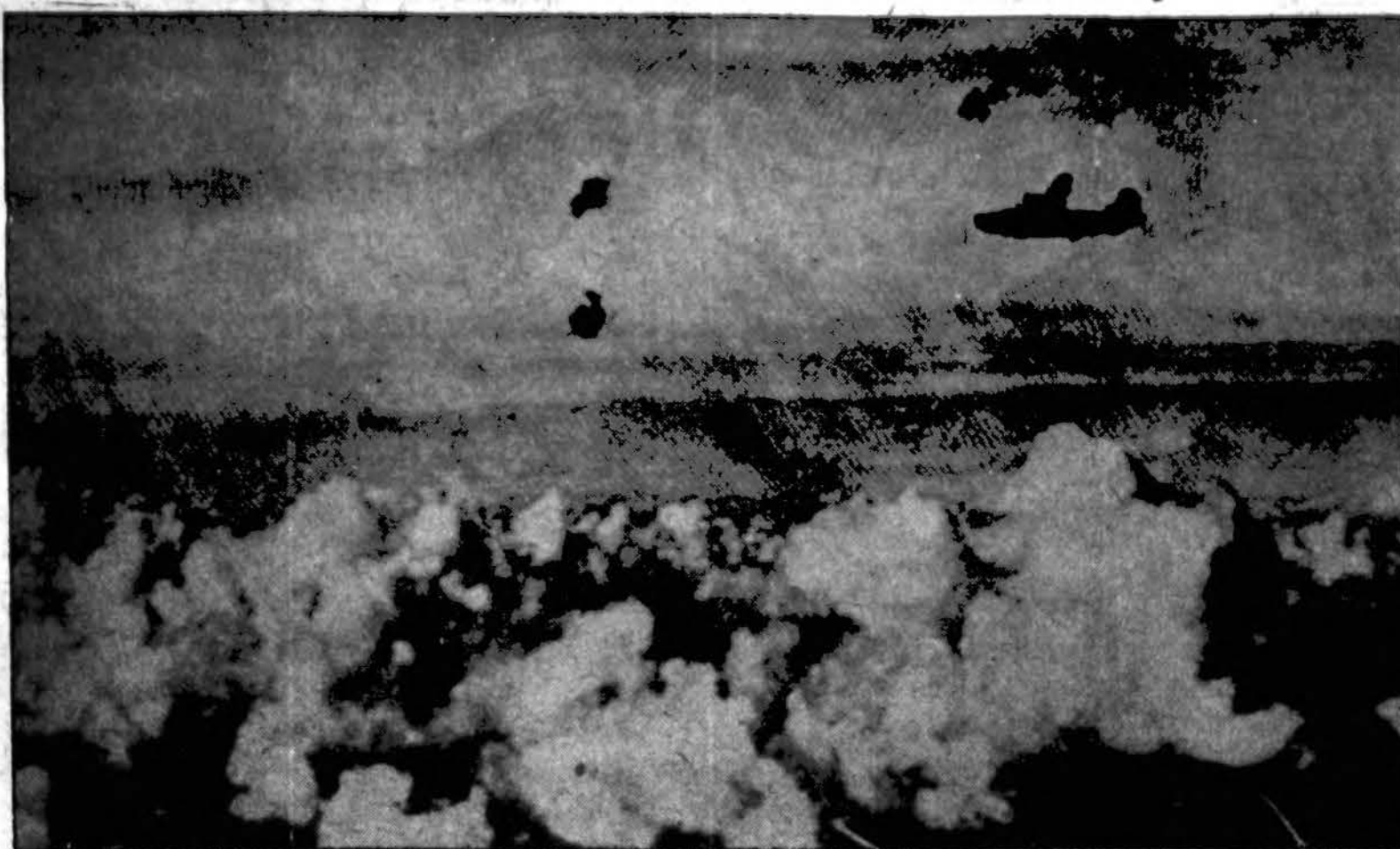
Vienas Amerikos didžiųjų bombierių ruošiasi nugabenti ir numesti tonus bombų ant japonų įsistiprinimų vienoje salose, tuo pačiu metu karo laivai daužo japonų pozicijas kitose salose.