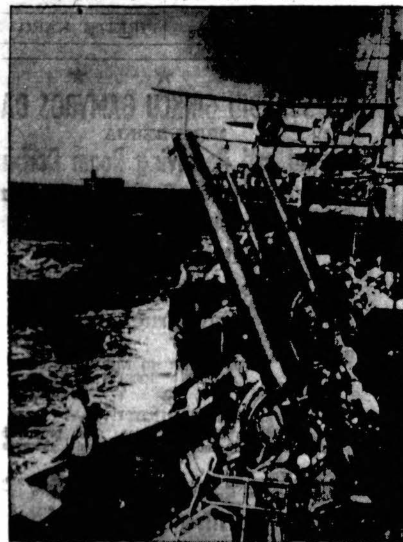
Laivyno Departamento leista spaudai ši nuotrauka rodo Amerikos karo laivus, koncentruojamus kovoms apie Marshall salas. Laivai įvairaus tipo ir rūšių.