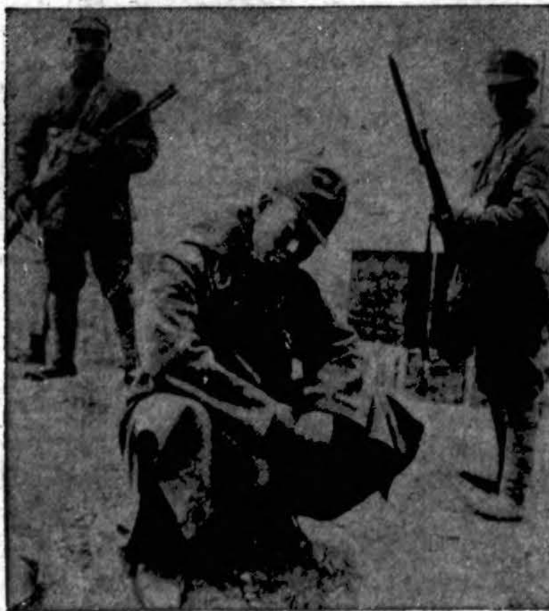
Du kinų kareiviai saugo paimtą ir nelaisvę japoną. Hunnan provincijoje, vadinamam "ryžių blude", pastaruojau laiku buvo aršios kovos, kuriose japonai labai nukentėjo.