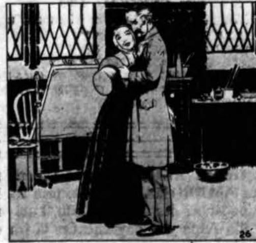
Bernadetos tėvelis atvažiavo