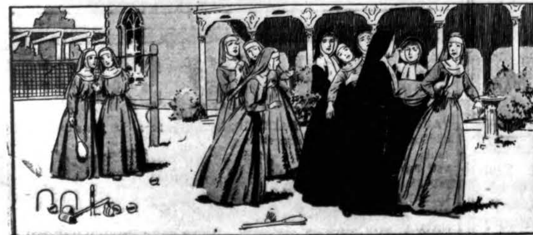
Vienuoelės nunešė Bernadetą į lovą