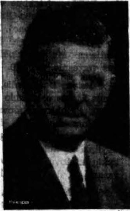
EDWARD J. KELLY Chicago Mayor

WHEREAS, Americans of Lithuanian descent and background have steadfastly subscribed and adhered to the principles of democracy and freedom as set forth in the Constitution of the United States; and