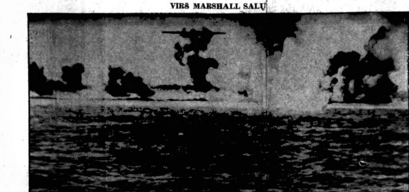
Amerikos vidutinio dydžio Mitchell bombieriai raižydami orą žemai virš Marshall salų sėja bombas ant japonų tvirtovių. Admirolo Chester Nimitz apskaičiavimu, iki šiol kovose šiam salyne 8,386 japonai žuvo arba paimti į nelaisvę. Amerikos nuostoliai yra 1,516 vyrų ir iš jų tik 286 žuvę.

Cassino apylinkėje amerikiečiai suėmė 500 nacių belaisvių.