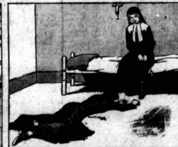
Ji išgriuvo prie Bernadetos kojų