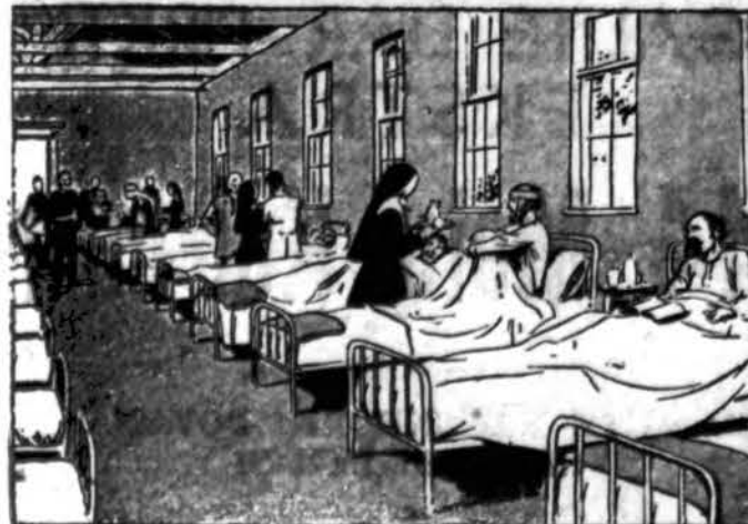
Bernadeta slaugo karo sužeistuosius