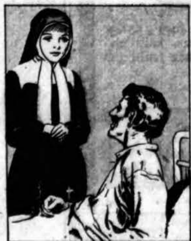
Jos žvilgsnis suramina ligonis