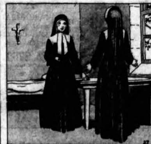
—Pagelbėk man,—prašė Sesuo Marija