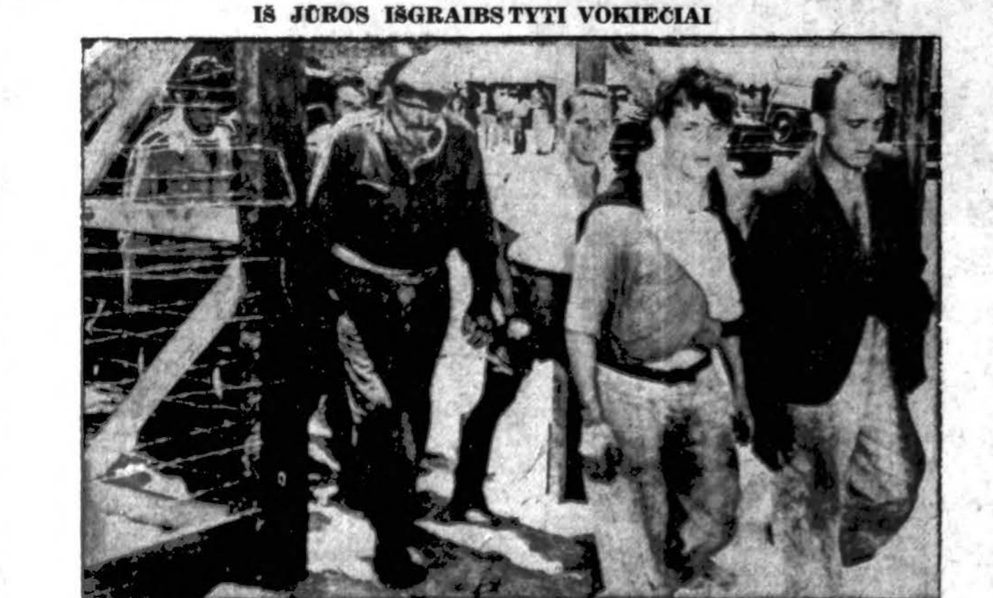
Amerikos karo laivai, Atlante nuskaudinė tris vokiečių karo laivus su labai reikalinga naciams karo medžiaga, išgraibstė iš vandens įgulos narius, kurie nuotraukoj maršuoja į nelaisvę.

— ★ — SIŪSKITE KALENDORIŲ DOVANAS SAVO GIMINEMS! — ★ — SKLEISKITE KATALIKIŠKĄ DVASIAŲ KALENDORIAIS! — ★ — "DRAUGAS" TURI GRAZIAUSIUS LIETUVIŠKUS KATALIKIŠKUS KALENDORIUS VISOJ AMERIKOJ! — ★ — KAINA — TIKTAI 25 CENTAI — ★ — Siųskite jusų užsakymus šiuo adresu — "DRAUGAS" 2334 S. Oakley Ave. Chicago 8, Ill.