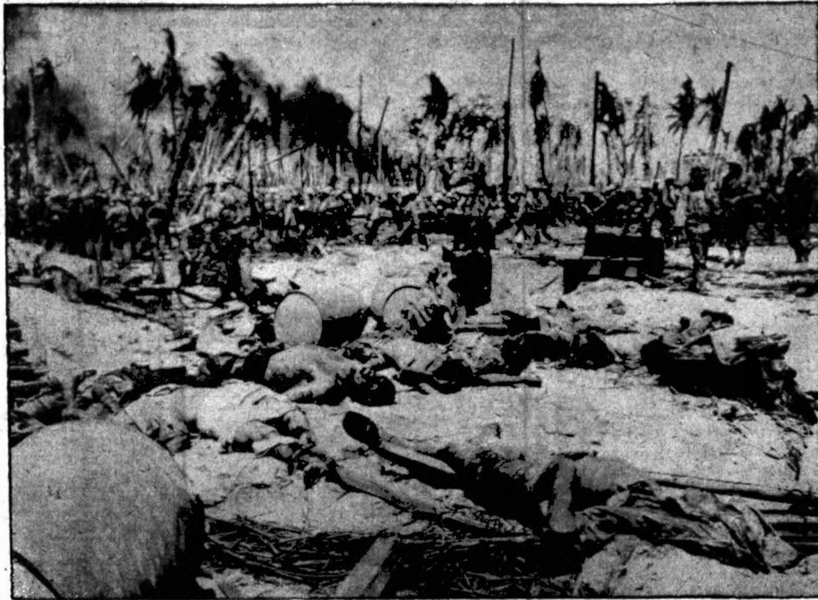
Namur saloje Amerikos marinai pereina griūvėsius tvi rtovių, kuriose buvo įsistiprinę japonai. Salvės kanuolių iš karo laivų, lietus bombų iš karo lėktuvų geležį sulanks tē, betoną sutrupino, o jų gynėjai-japonai lavonais nukloti visu pakraščiu. Tolumoje dar matosi rūkstą dūmai iš degančių griūvėsių.