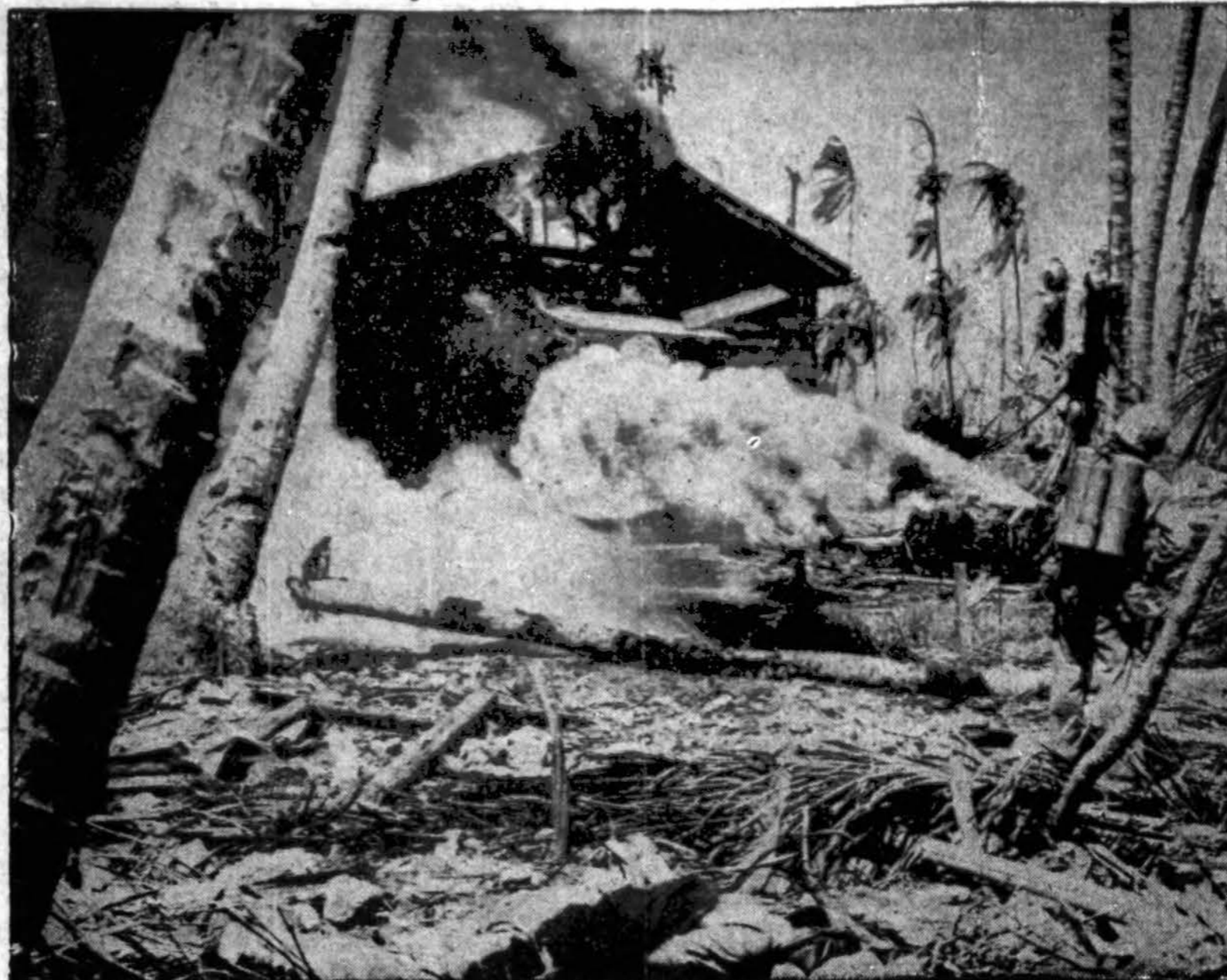
Vienas marinių Namur saloje liepsnosvaidžiu naikina japonų pastatus. Kwajalein atolyje invazijos metu mariniai daugiausiai varėjo liepsnosvaidžius prieš pasitikusiu s juos japonus.

Klūbo susirinkimai dabar yra vieni pavyzdgingiausių. Po visų lermų, kuruos sukeldavo būrelis mėgstančių suirutes, netvarką, dabar tyku, ramu, net malonu ateiti ir pašvęsti keletą valandų bei pažiūrėti, kokius gražius darbus nariai atlieka. Mintyje turiu parengi-