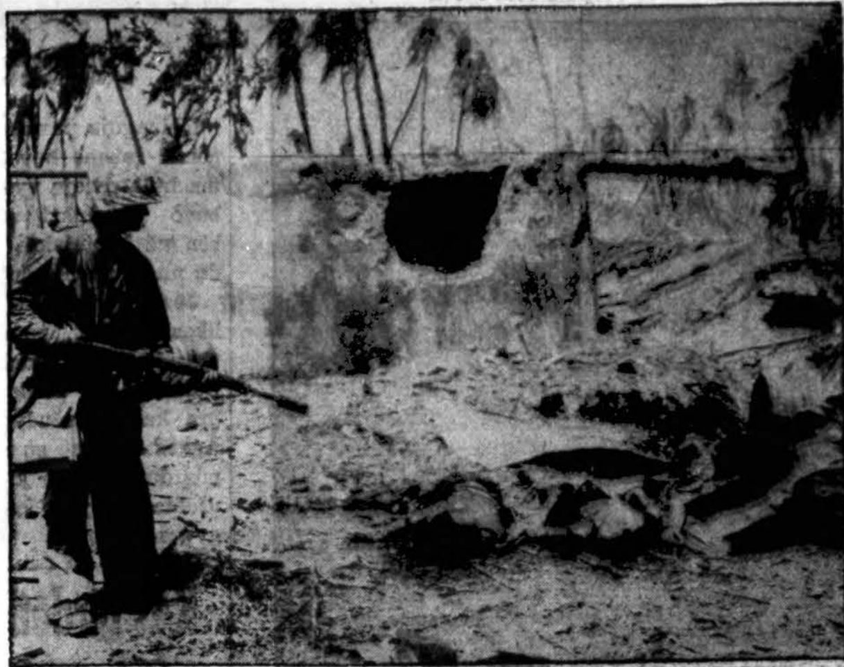
Po aršios kovos Namur saloje, kurioje mirusiai panaudojo liepsnosvaidžius, vienas mūsų karių susikaupęs prie dviejų kritusių japonų.