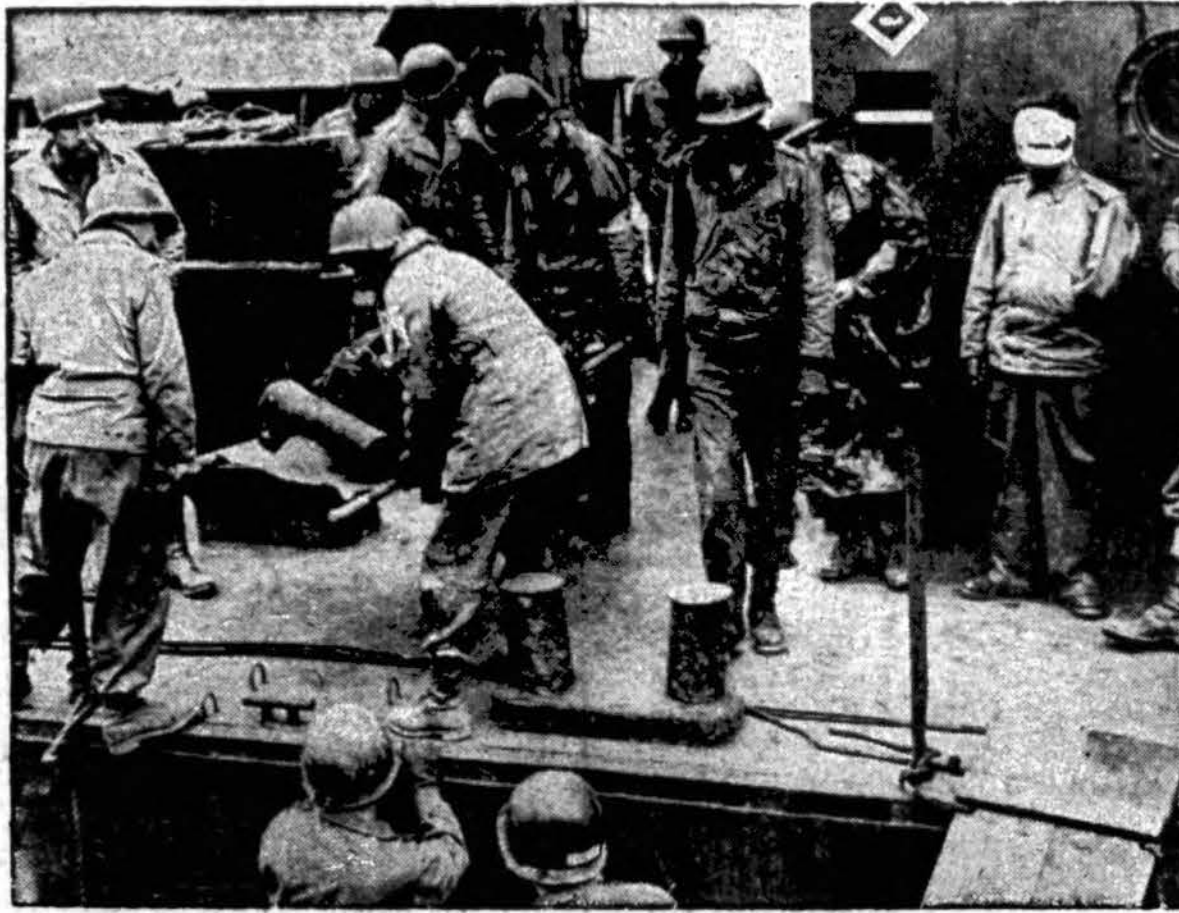
Sužeisti kariai, kurie dar gali patys paeiti, žiūri kaip jų draugai, sunkiai sužeisti dideliuose mūšiuose prie Anzio-Nettuno, nešami į karo laivus nugaubenimui į bazo ligoninę.