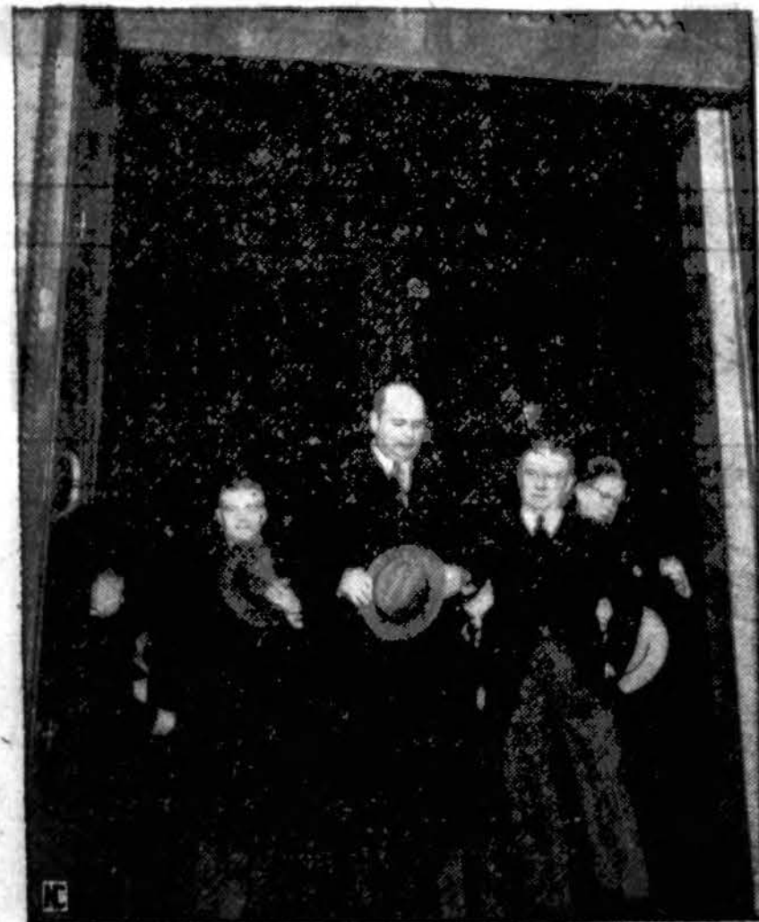
Isaias Medina, Venezuela respublikos prezidentas, vi- zito metu Washington su savo palydovais įeina į šv. Mato katedrą išklausti šv. M'sių. Venezuela respublika yra Pietų Amerikoje.