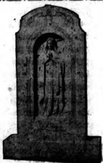
Mūsų pastatytas TEVAMS MARIJONAMS

DIDYSIS Ofisas ir Dirbtuvė: 527 N. WESTERN AVE. (Netoli Grand Ave.) PHONE: SEELEY 6100