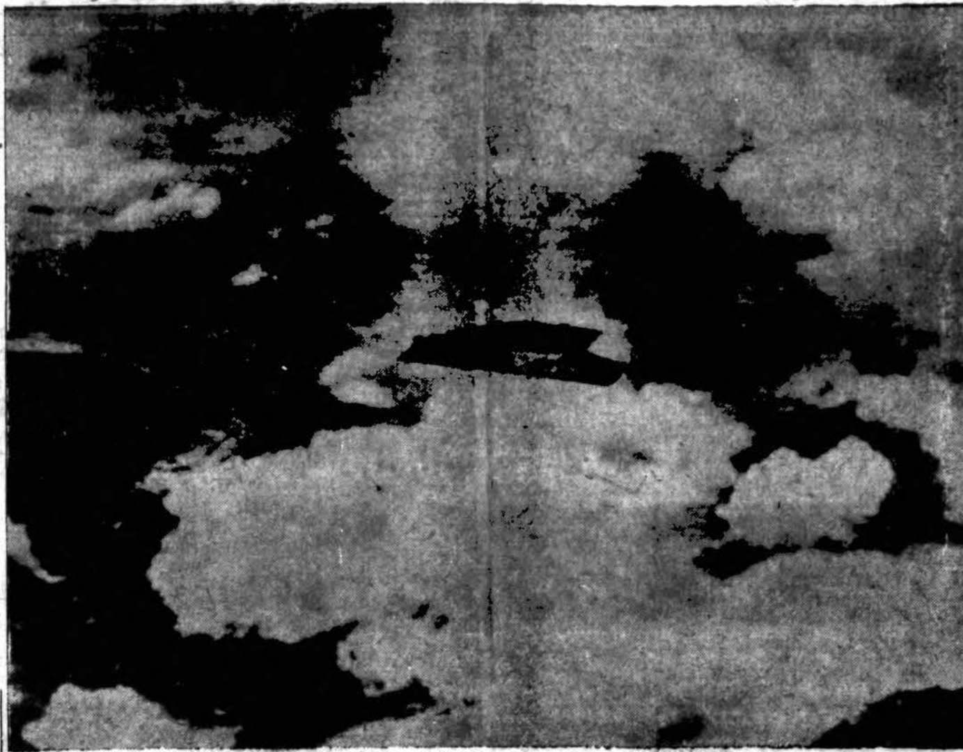
U. S. Marine Corpuso lakūnai pravėrė japonų smarkiai saugomą paslaptį kuomet du žvalgybiniai lėktuvai padarė šitą ir kitas nuotraukas vasario 4 d., žvalgybinės patrolės metu. Jų parvežtos informacijos buvo naudojamos laivyno atakai. Lakūnai sakė jie suskaitė 25 laivus ir atrodo, jog japonų laivynas randasi tame uoste. Marine Corps nuotrauka siūsta per radio iš Honolulu. (Acme-Draugas Telephoto.)