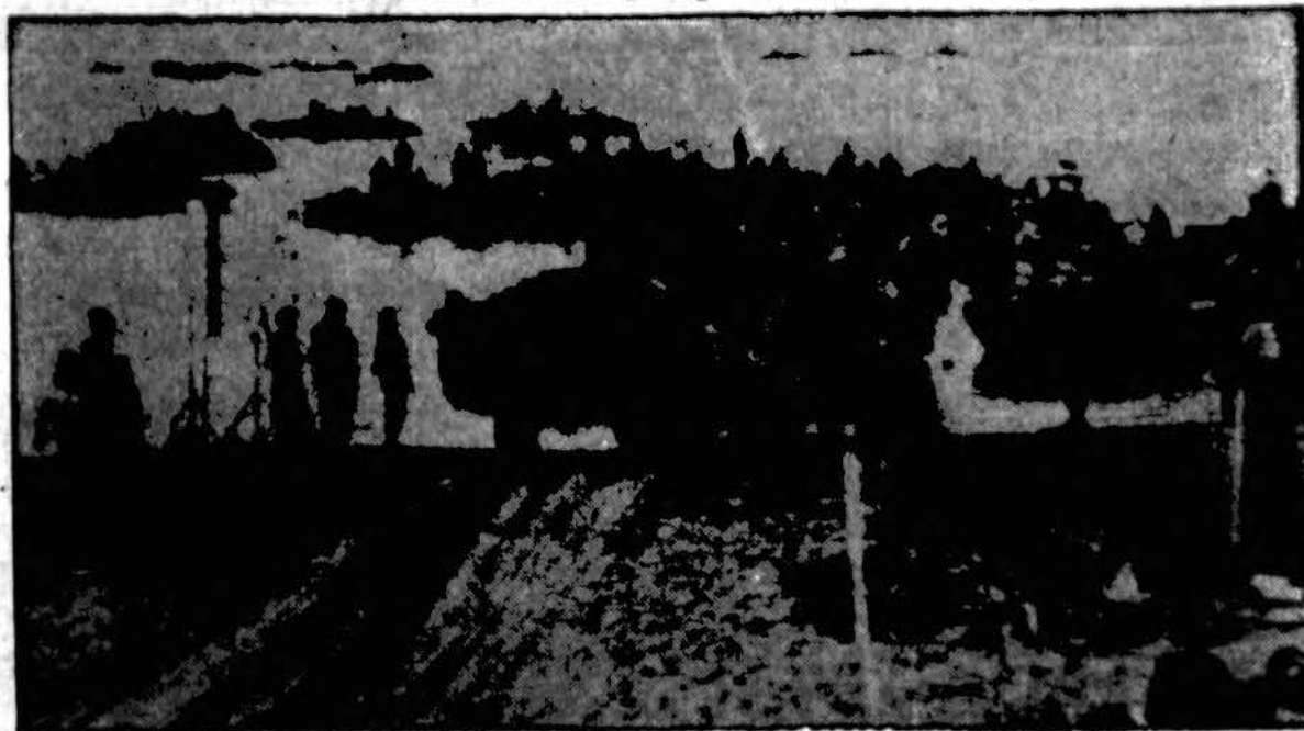
Anzio prieplaukoj, nacių užnugaryje, vadinamam Romos fronte, išsodinami nauji amerikiečių ir britų kariuomenės daliniai sulaužymui vokiečių linijos, kur vokiečiai yra sutraukę dideles savo jėgas.