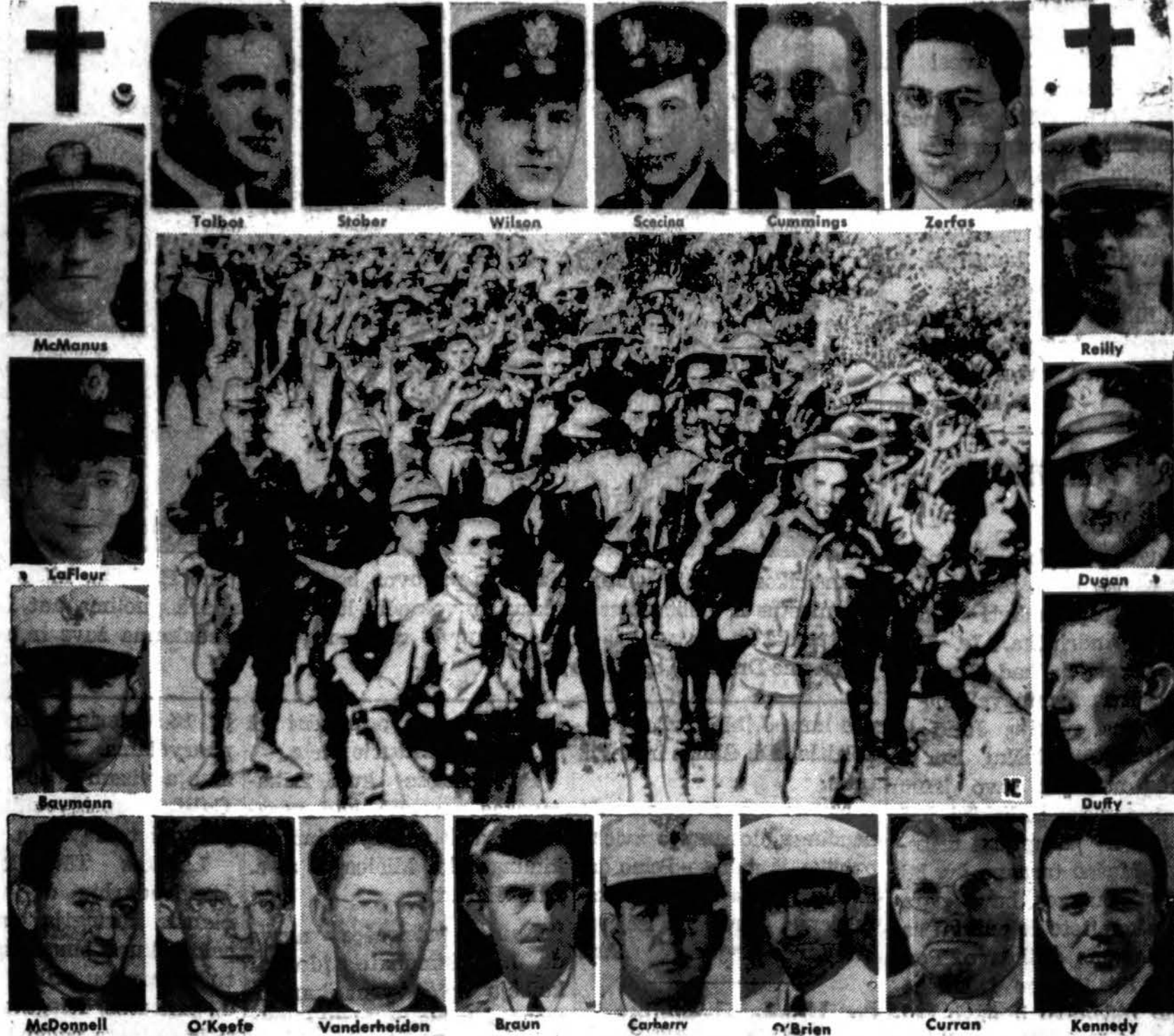
Viena nuotraukų, slapta išmugelizuotų Amerikon, rodo jau plačiai spaudoje aprašytą "Mirties Maršą", kuriame žuvo tūkstančiai amerikiečių ir filipiniečių karo belaisvių Sykiu su paprastais kareiviais visas kančias turėjo pakelti ir katalikai, karo kapelionai, kurių atvaizdai aplink sudėti, kurie sykiu pateko į japonų nelaisvę.