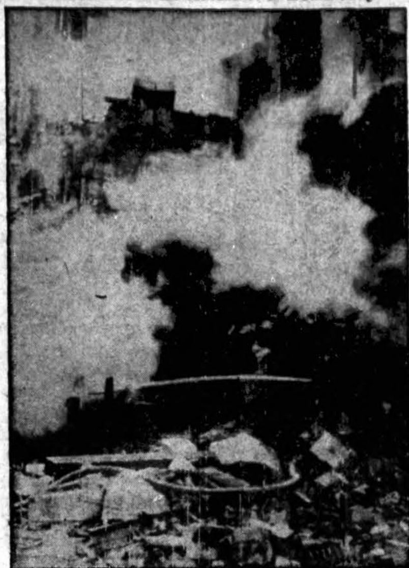
Londono ugniagesiai darbuojasi suvaldyti gaisrus, kuriuos sukėlė 50 vokiečių lėktuvų, atsikridusių bombarduoti britų sostinę. Šiuo tarpu vokiečiams pavyko padaryti žymesnių nuostolių.