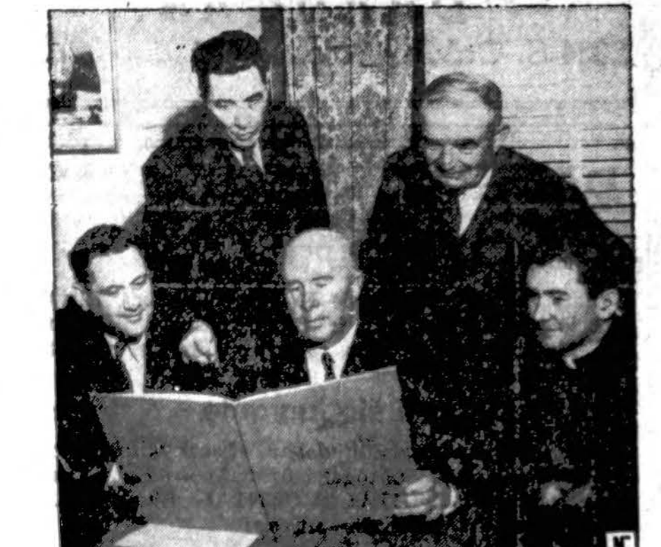
Pietinės Kalifornijos valstybės 1,800 viešųjų ir parapijinių mokyklų atstovybė, kuri vedė vaju Ketvirtosios Karo Paskolos, taip pat pardavinėjimą karo ženklelių.