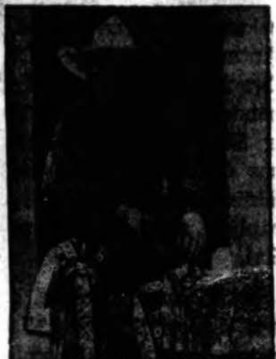
Vienas Rodeo-Cirko dalyvis

Coliseumas vaidžios gražintas civilinėms pramogoms, dabar naujai atremontuotas, suvestos naujos šviestos ir įrengti nauji suolai žmonėms susėsti.