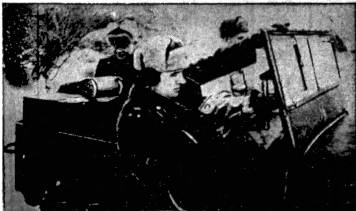
Vienas Sov. Rusijos kariuomenės vadų, važinėdamas jeapu, vadovauja kariuomenei Korskun rajone, kur, sakoma, rusai buvo apsupę ir sunaikinę dešimtis tūkstančių vokiečių, ir kuri šiuo metu skina kelią į Pskovą ir Latviją.

"LAIVAS" 2334 S. Oakley Ave., Chicago, Ill.