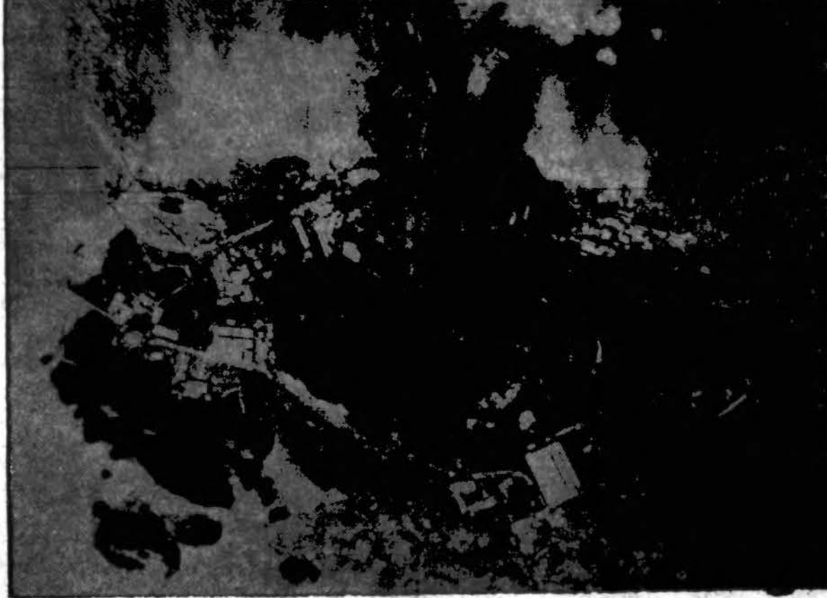
Nuotrauka iš 10,000 pėdų aukštumos rodo Ponape atolyje japonų fortifikacijas, iš kurių kyla dulkių ir dūmų stulpai. Amerikos Liberatoriai (bomberiai) vienas paskui kitą jas griauja.