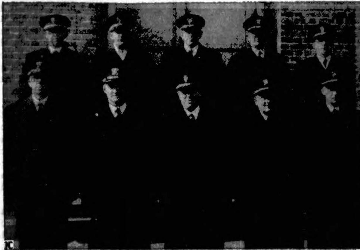
Laivyno kapelionų kolegija, kuri randasi Williamsburg, Va., šiomis dienomis baigė vėl visa eilę kapelionų, kurių tarpe ir dešimts katalikų kunigų.

no pirmieji šio karo okupantai ir už tuos, mūsų pačių pinigus, tur bū, varo prieš mus propagandą. Atsiranda žmonių, gal už tuos pačius pinigus, rašančių spaudoje ar leidžiančių knygas, nukreiptas prieš Baltijos kraštų nepriklausomybę. Kai kurie tų autorių tvirtina esą tų tautų nariais. Nei vienas padorus sūnus nenorės, kad jo tėvai vergautų svetimiesiems. Tokie autoriai yra lygiai tiek pat savo tautos nariai, kiek tūmoros yra kūno daliais. Tai yra bolševikiška votis ant savo tautos kūno.