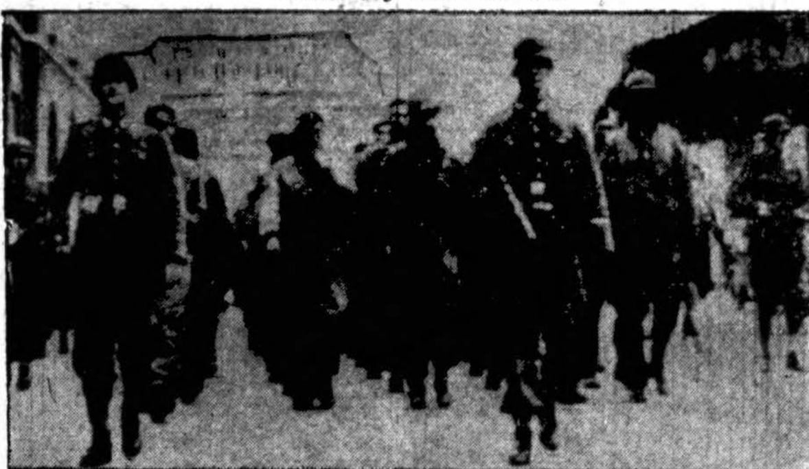
Ši nuotrauka Amerikoje gauta iš Stockholmo, Švedijos. Vokiečių pranešimu, tai amerikiečiai ir britai, kurie buvo paimti į nelaisvę Anzio fronte, maršuoja per Romą.