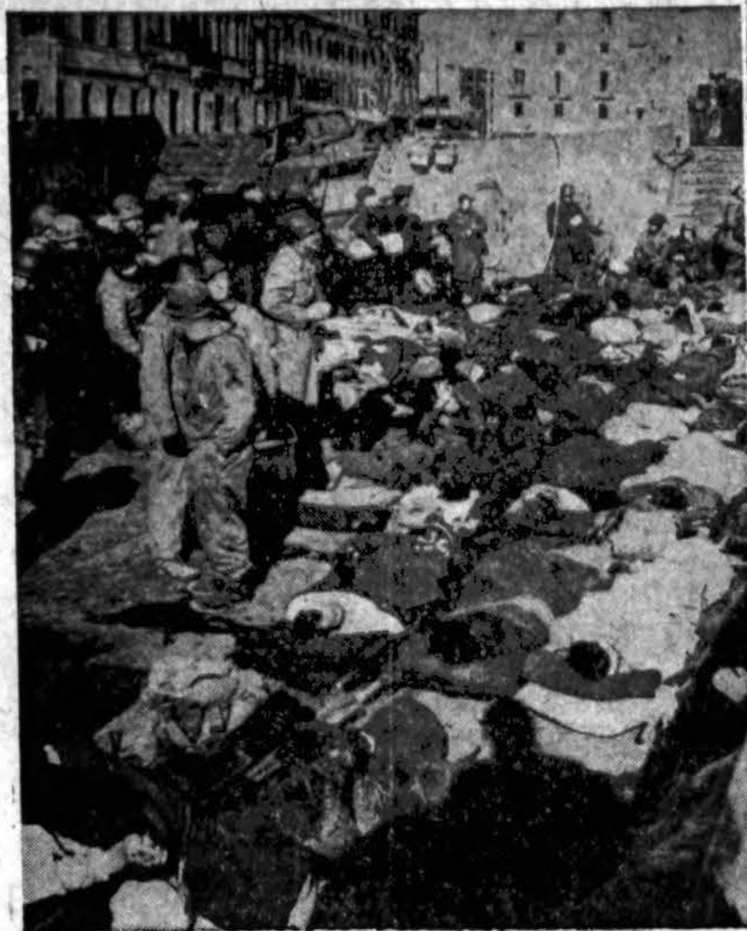
Anzio-Nettuno fronto, Italijoje, kovų dalyviai sąjungininkai laivė jūros pakraštyje laukia pervežimo į ligoninę.