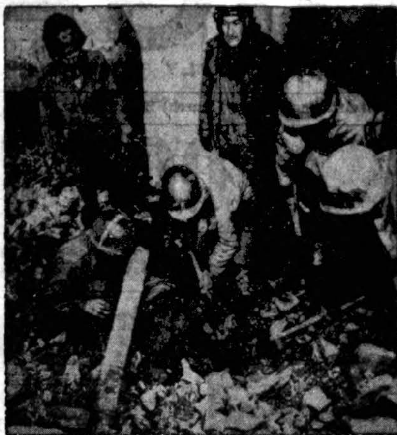
Italijos fronte vienoje vietoje amerikietis kareivis raudonas po griūvėsiams norėdamas surasti savo draugą, kuris buvo užgriautas, kuomet nacių lėktuvo bomba pataikė į šį namą.