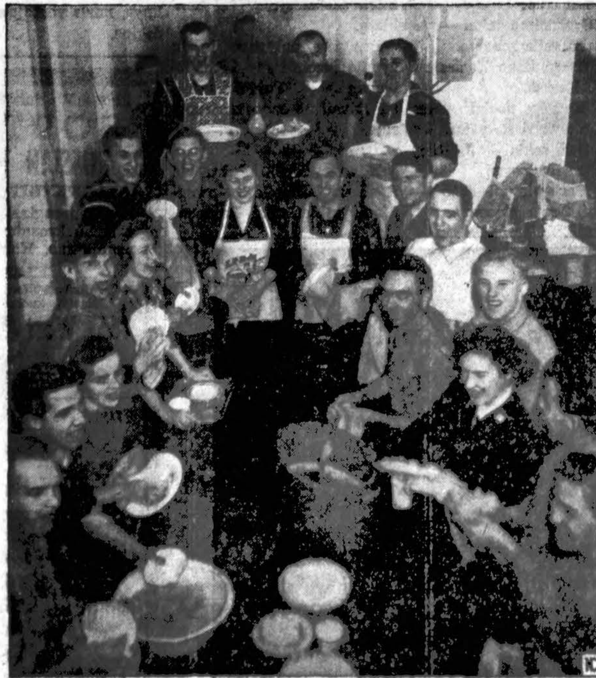
Charleston, So. Carolina, National Catholic Community įsteigtas USO klubas kiekvieną sekmadienį išduoda pusryčių trim šimtsams kareivių. Nuo praėtų metų balandžio mėnesio, kuomet šis klubas buvo įsteigtas, iki šiol yra išdavęs 10,000 pusryčių. Atvažde katalikų jaunimas, kurs kiekvieną sekmadienį susirenka indų plauti. Pusryčius gamina seserys-vienuolės. (NCWC-Draugas)