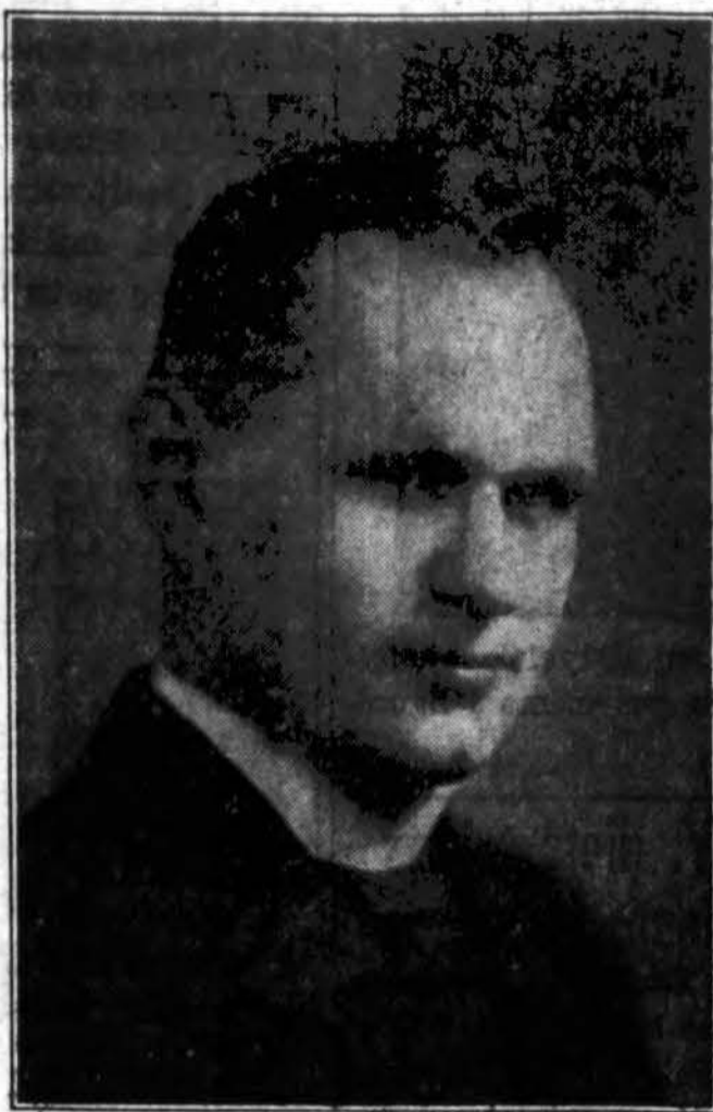
Nuosirdus jaunimo veikėjas ir prietelis, Kun. Julius Grinius

Beveik du šimtu metų po pirmosios Sodalicijos įsteigimo, jos pamokymai pradėjo skleistis Amerikoje. 1738 metuose vėl jėzuitų