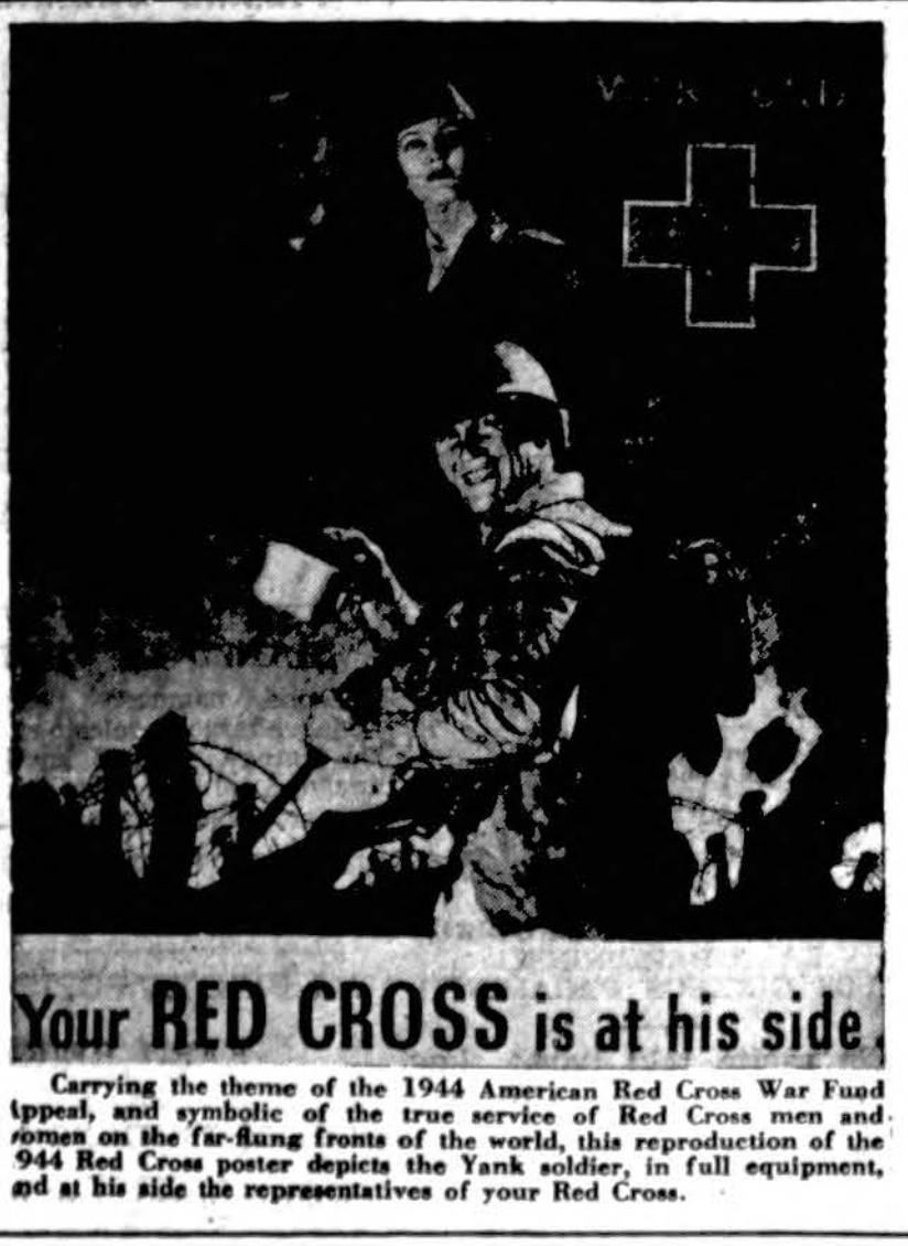
Your RED CROSS is at his side Carrying the theme of the 1944 American Red Cross War Fund appeal, and symbolic of the true service of Red Cross men and women on the far-flung fronts of the world, this reproduction of the 944 Red Cross poster depicts the Yank soldier, in full equipment, and at his side the representatives of your Red Cross.

Remkite ir platinkite "Draugą", nes jis ir jus remia ir kovoja už kilnius idealus.