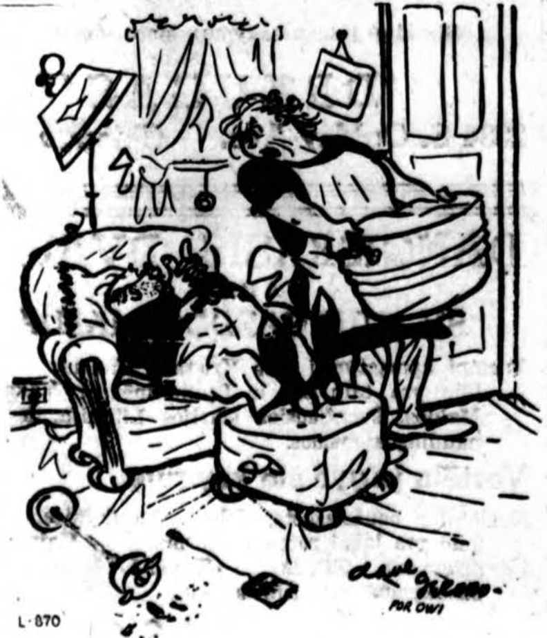
"All right! You're savin' shoe leather! And ya ain't travellin' and ya ain't usin' the phone and ya ain't wastin' fats—But ya ain't winnin' this war either!"