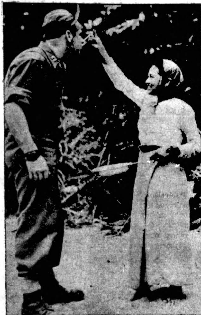
Laisvą nuo pareigų valandą Amerikos kariuomenės kapitonas ir burmietė kariuomenės slaugė vaišinosi amerikoniškais valgiais.

"DRAUGO" DARBU SKYRIUS "DRAUGAS" HELP WANTED ADVERTISING DEPARTMENT 127 No. Dearborn Street Tel. RANDolph 9486-9489