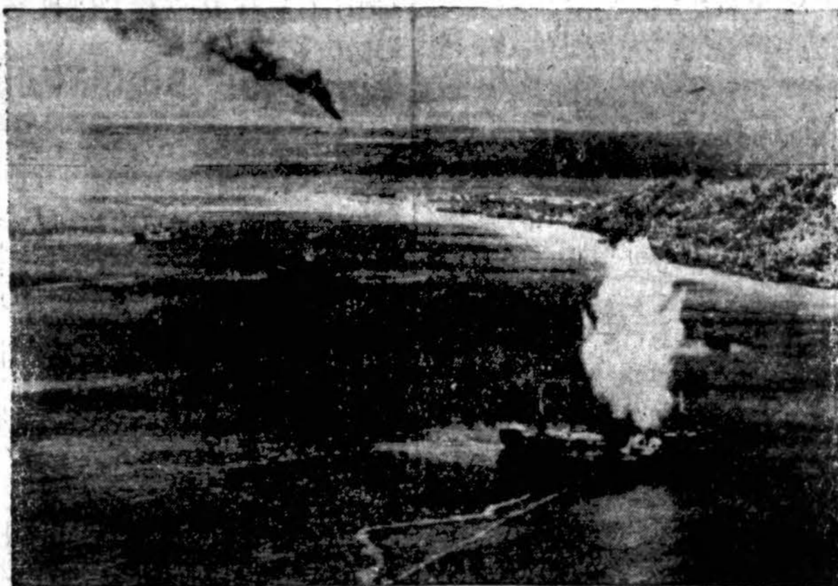
Torpeda iš laivyno lėktuvo, pakilusio nuo lėktuvnešio, pataikė tiesiog į japonų tankerį vasario 16 d., atakos ant Truk bazės metu. Vandeny matosi torpedų paliktos žymės. Dūmai užpakaly kyla iš Aerodromo Eten saloje.