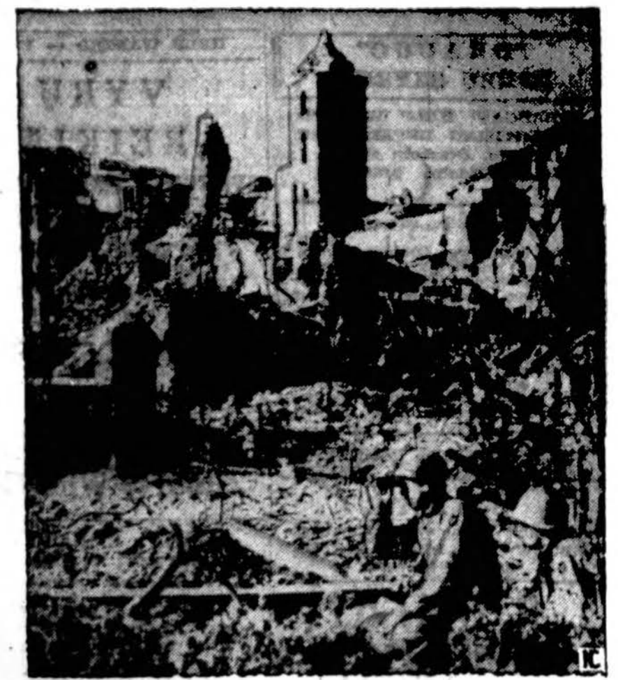
Cassino regione, Italijoje, viena katalikų bažnyčių pirmiau kiekvieną kelevį žavėjusi savo grožiu, dabar tik griūvėsių krūva. Du Amerikos kariai žiūronais seka vokiečių pozicijas.