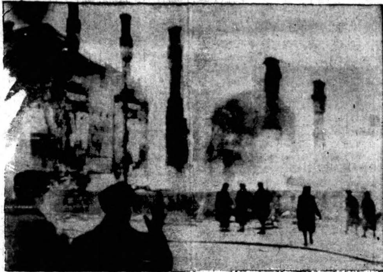
Aukšti kaminais stuko tarp rūkstančių griuvėsių po 600 rusų lėktuvų atakos ant Helsinkio vas. 26 d., suomiams besvarstant rusų siūlomą taikos sąlygas. Antraštė šiai pirmajai radiografijai persiūstai iš Stokholmo į New Yorką, sakė nuotrauka padaryta "visiškai išgriautoj daly miesto centro."