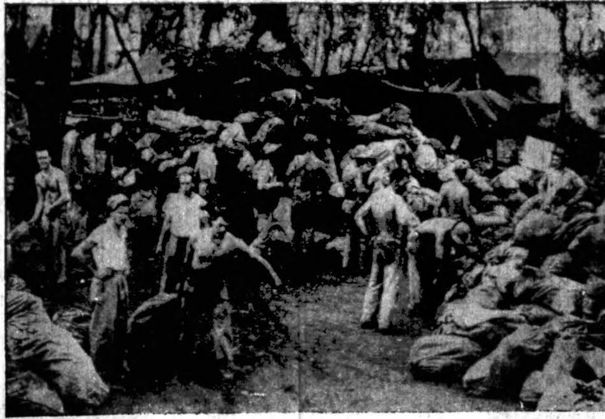
Neprašius nė savatei po marinių išlipimų Cape Gloucesterį, jiems atvyko ir paštas. Čia matoma kaip šimtai maišų geriausių “moralės palaikytojų” sortuojami tuoj už priešakinių linijų.