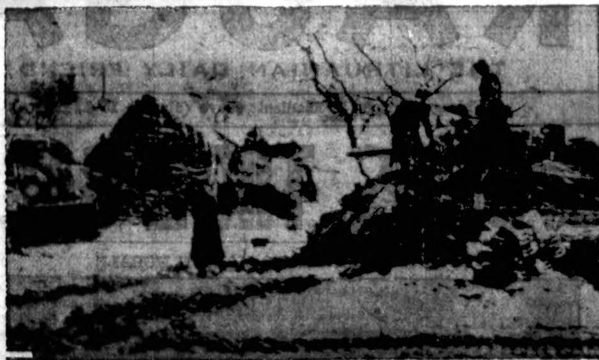
Britų Aštuntosios Armijos fronte Italijoje veiksams pastaruoju metu labai kenkia sniego pūgos. Kai kuriose vietose tiek pri-versta sniego, kad norint tankais pasistumti pirmyn, pirmiausiai reikia sniegą nukasti.