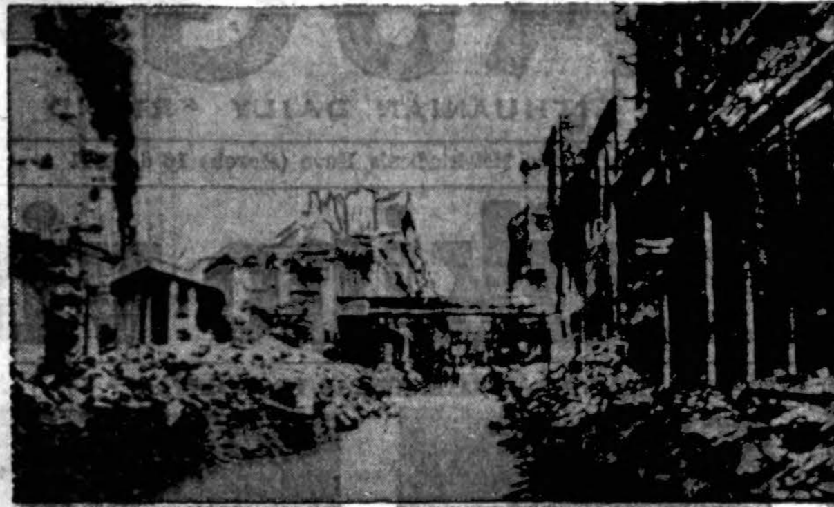
Iš neutralių šaltinių gauta ši nuotrauka parodo vieną gatvių žymiausio Vokietijos uostinio miesto — Hamburg, kuris nežiūrint kad jau paverstas griūvėsiais, vis dar Anglijos "Mosquitos" bombierių atakuojamas