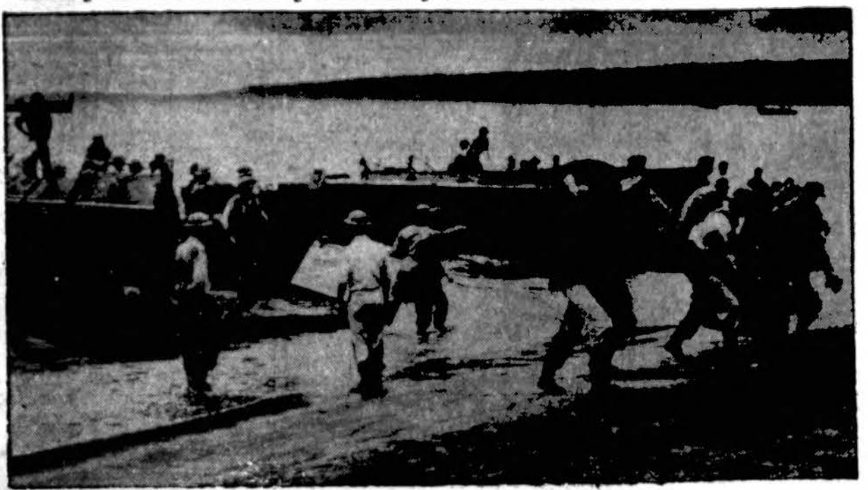
Britų kariuomenė kur nors Pacifike arti susijungimo su Amerikos kariuomene. Atvaizde iškraunama amunicija ir kitokie karo reikmenys atvykusiai britų kariuomenei.