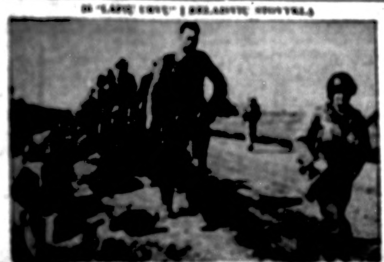
Caption for the group photo.