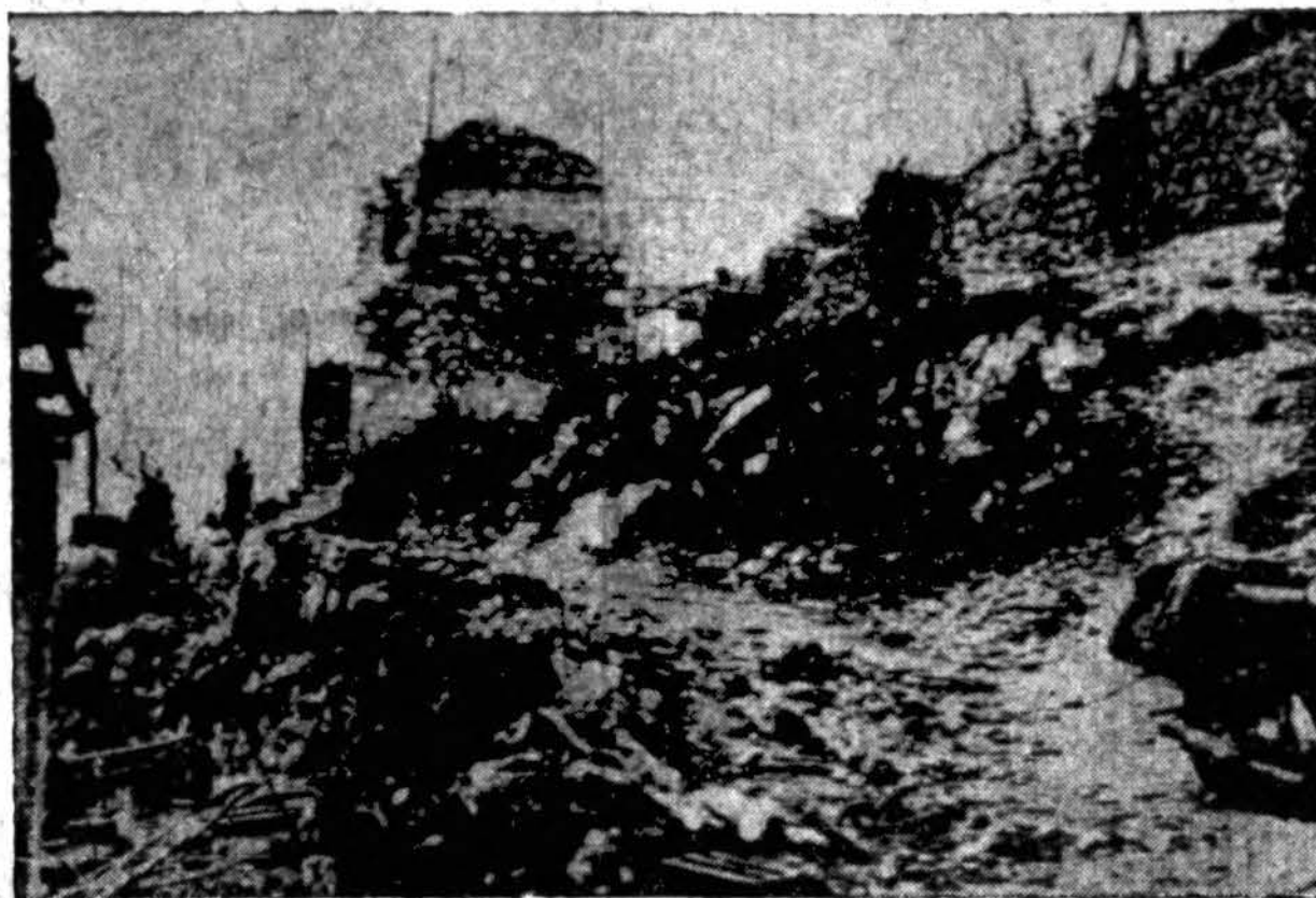
Nežiūrint didelių lėktuvų atakų ir artilerijos apšaudymų, vokiečių mortarų ir kulkosvaidžių lizdai vis dar pastoja kelią sąjungininkams kariams išgriaunam Cassino mieste. Čia matoma, kaip sąjungininkai kariai žygiuoja miesto pakrašty ir ieško priešų "snaiperių."

ZINGSNIS PO ZINGSNIO STUMIA NACIUS IŠ CASSINO