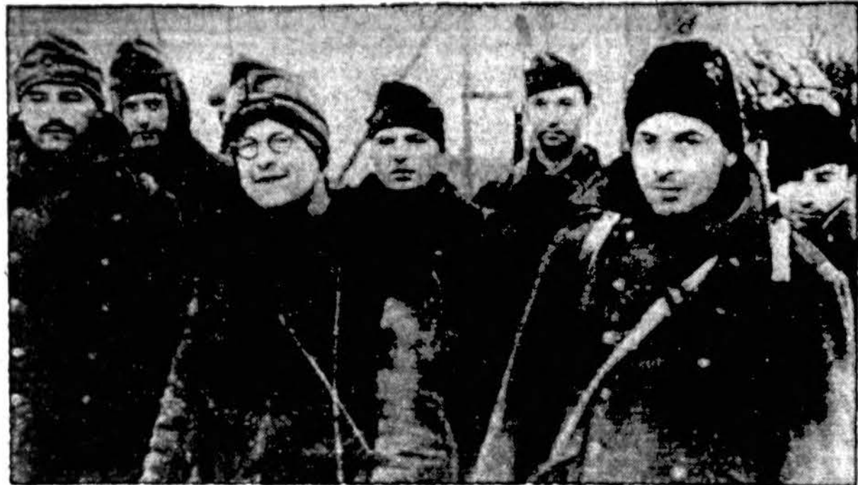
Ukrainos fronte raudonoji armija nesulaikomai eina pirmyn ir jau besanti netoli Prut upės, kuri skiria Rumuniją nuo Besarabijos. Šiame atvaizde vengrų kareiviai vokiečių kariuomenę, kuriuos rusai paėmė į nelaisvę. Atrodo, kad jie net patenkinti.