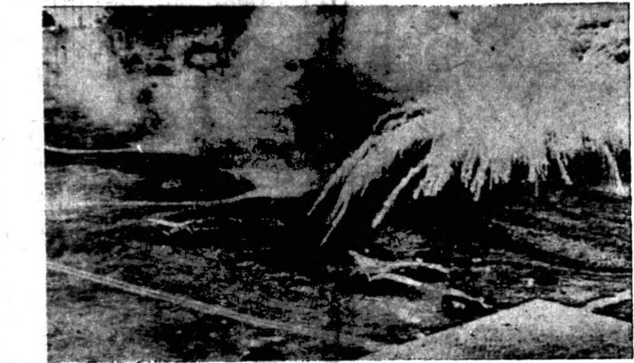
Sprogdama virš japonų bomberio ir naikintuvo Lakūnai aerodrome, Rabaul bazė, New Britain saloje, armijos naujoji 100 svarų balto fosforo bomba pasirodo esanti efektyvi prieš ant žemės esančius lėktuvus ir priešlėktuvinių patrankų pozicijas. Palietus taikinį ar žemę bomba sprogdta ir išsklaido degantį fosforą.