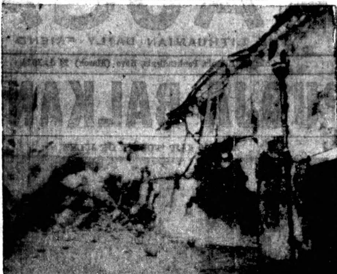
PRADĖJO VEIKTI KITA DIEVO RYKSTĖ

Moters rankos pūkai, širdies meilė vynas, lūpos angelų svaigalai, bet jos išmetinėjimo žodžiai, sunkiausiai akmenys.