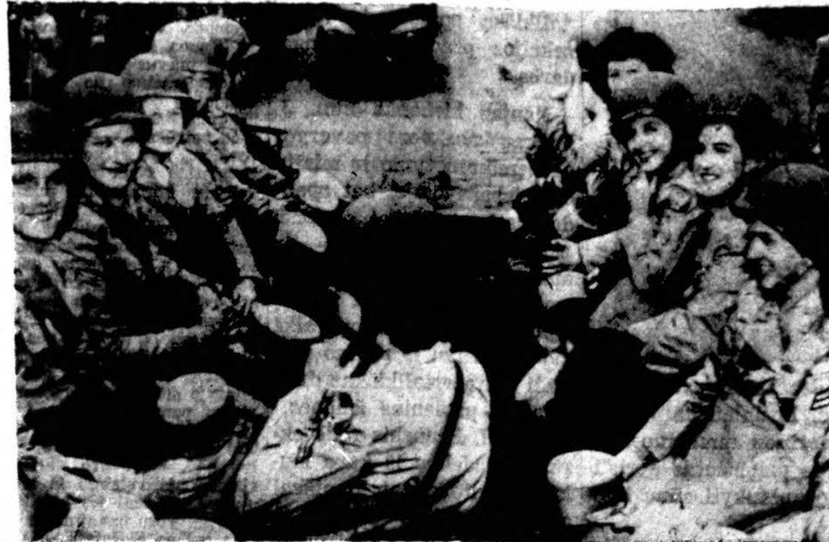
Vienam Hawaii salų uoste atplaukęs Amerikos transportas. Tarp kitko, matome ir grupę WACS. Centraliniam Pacifike jos yra pirmutinės atsiųstos į Hawaii salas.