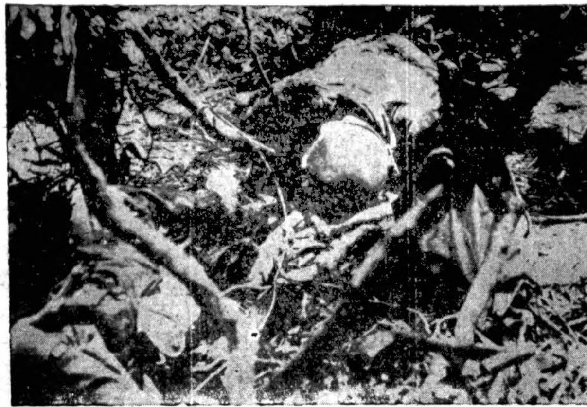
Karo fronte, einant žūbtūnei kovai, nėra vietos ašaroms. Bet šis Amerikos kareivis neišlaikė, kuomet ant kruvino kalno No. 206, netoli Empress August a Bay, Bougainville saloj, nuo japono kulkos žuvo jo draugas. Kairėj žemiau jo kritęs draugas.

Šių Velykų dienraščio "Draugo" numeryje pasibės, kad vienas kitatautis įmonininkas Labdarių Sąjungos statomai lietuvių senelių prieglaudai paaukoja stambią pinigų sumą. Šis geradaris, aukodamas mūsų prieglaudai, pastebi, kad jis tą daro, nes žino, jog lietuviams toji įstaiga yra būtinai reikalinga. Be to, jis sako: "Lietuviai mano įmonę paremia, todėl aš esu obliguotas jiems už tai bent dalinai atsilyginti". Jis tą auką teikia Velykų švenčių proga, lyg noredamas ir kitas paskatinti, kad panašiai pasielgtų.