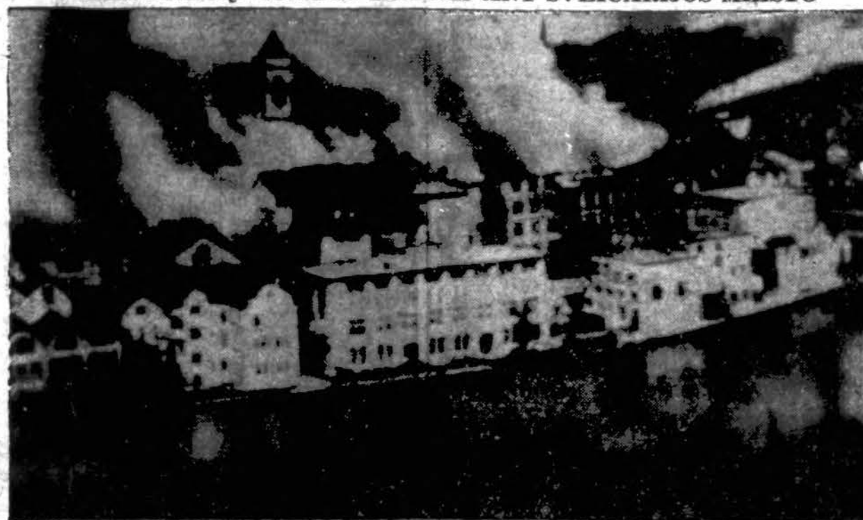
PER KLAIĐĄ NUMETĖ BOMBAS ANT ŠVEICARIJOS MIESTO

Dūmai kyla iš Schaffhausen miesto, Šveicarijoje, kur per amerikiečių lakūnų apsirėmimą numesta bomba. Bombos užmušė 35 asmenis tame mieste. Amerikos vyriausybė pasizadėjo užmokėti už visus padarytus nuostolius..