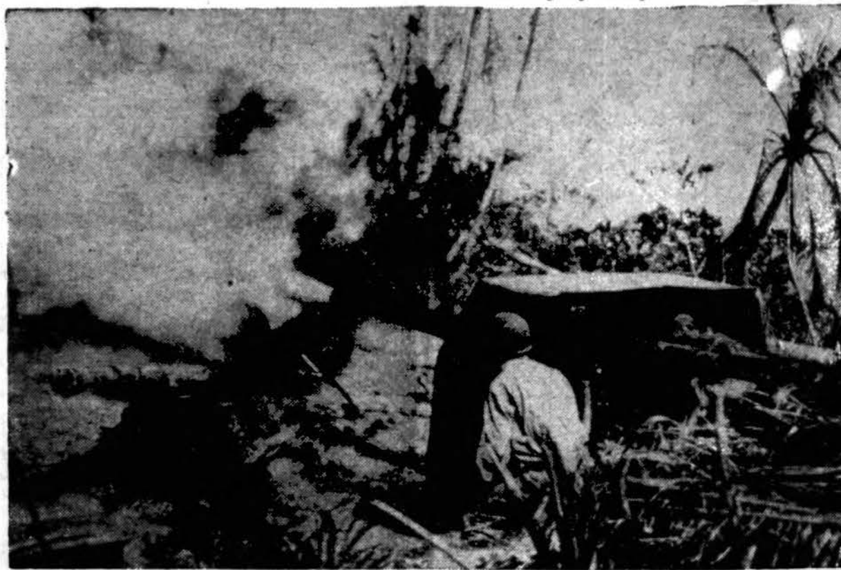
Amerikiečiai artileristai duoda japonams paragauti savo šovinių, kuomet jie atsuka suimta japonų patranką į gerai įsteigtą japonų poziciją vienoj Admiralty saloj.