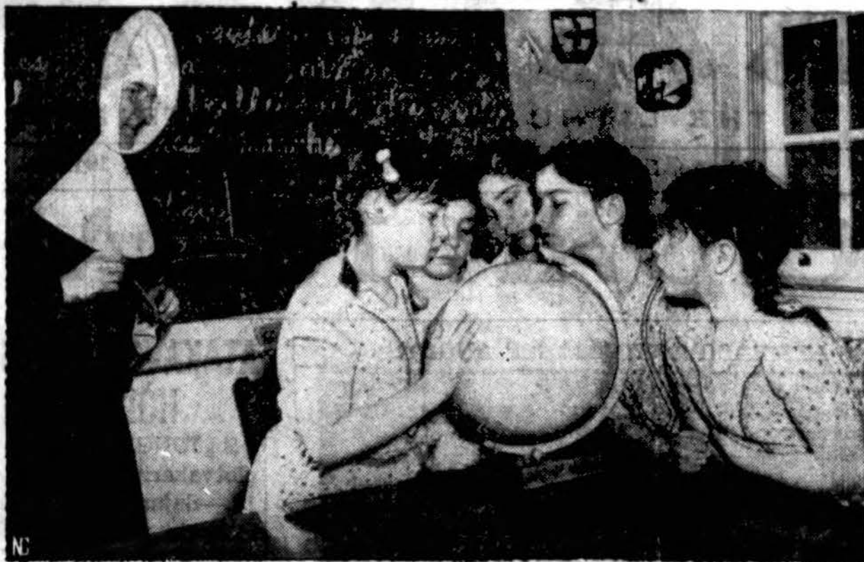
Garsios Kanados penkiukės mokykloje seka mokytojos vienuolės aiškinimus ir d. misi pasaulio įvykiais.