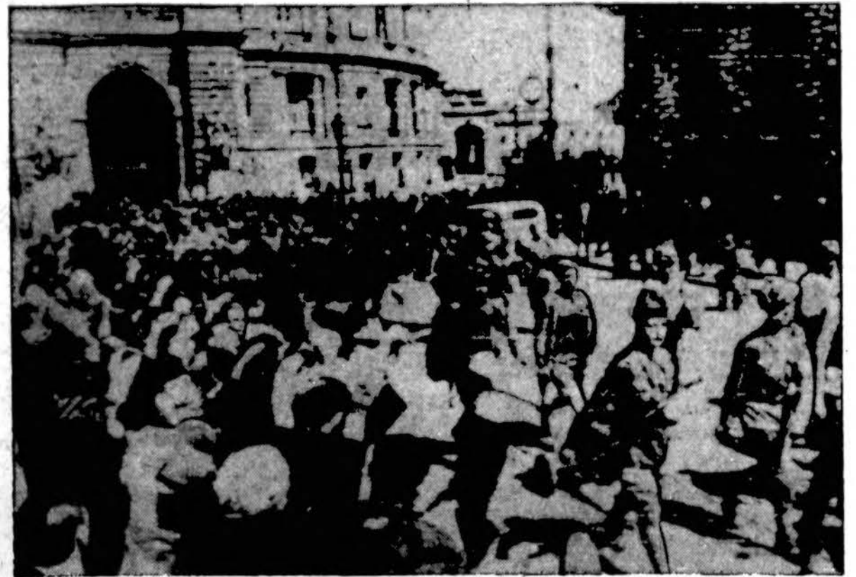
Odesos gatvėse civiliai gyventojai pasitinka raud. armiją, kuri, išvijus nacius ir rumunus, žygiuoja į Besarabiją.