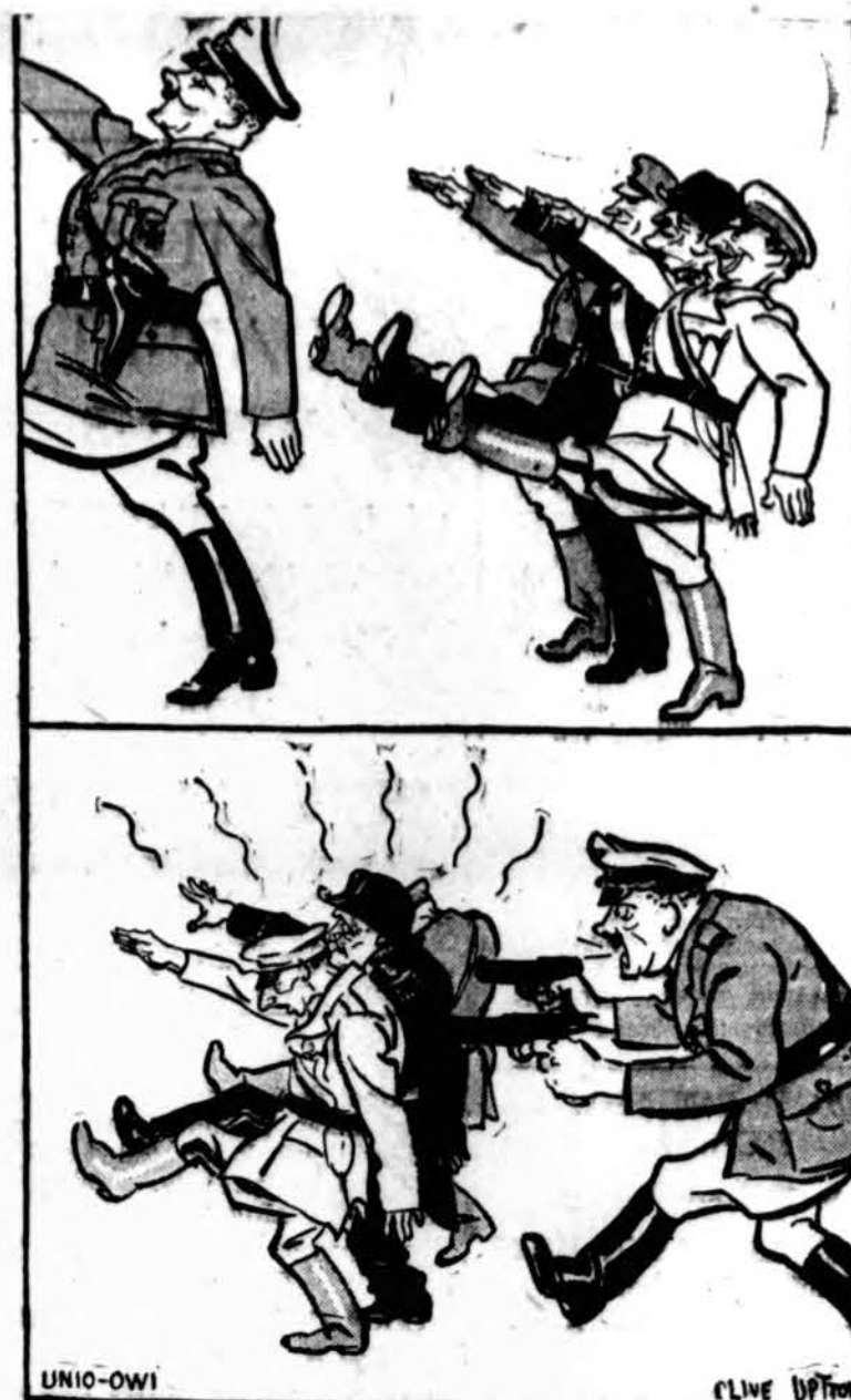
BALKANAI SENIAU IR DABAR