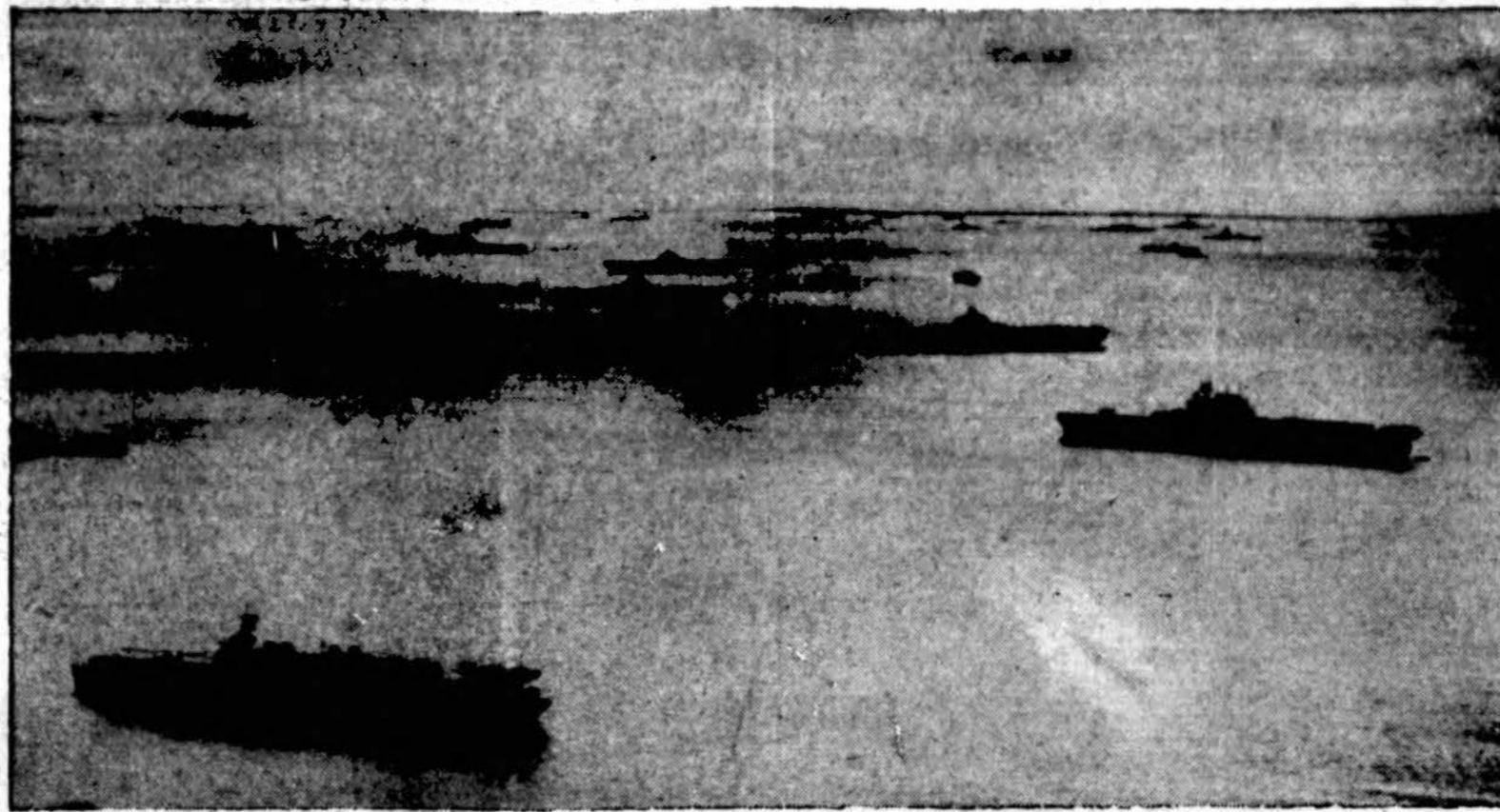
Bandras vaizdas Amerikos karo laivyno, stovinčio vien oį Marshall salų įlankoje. Šis laivynas išmušė japonus iš Marshall salų ir už savaitės po to smarkia ugnim iš laivų kanuolių ir lėktuvų bombų apgriovė stiprią japonų bazę Truk saloje.