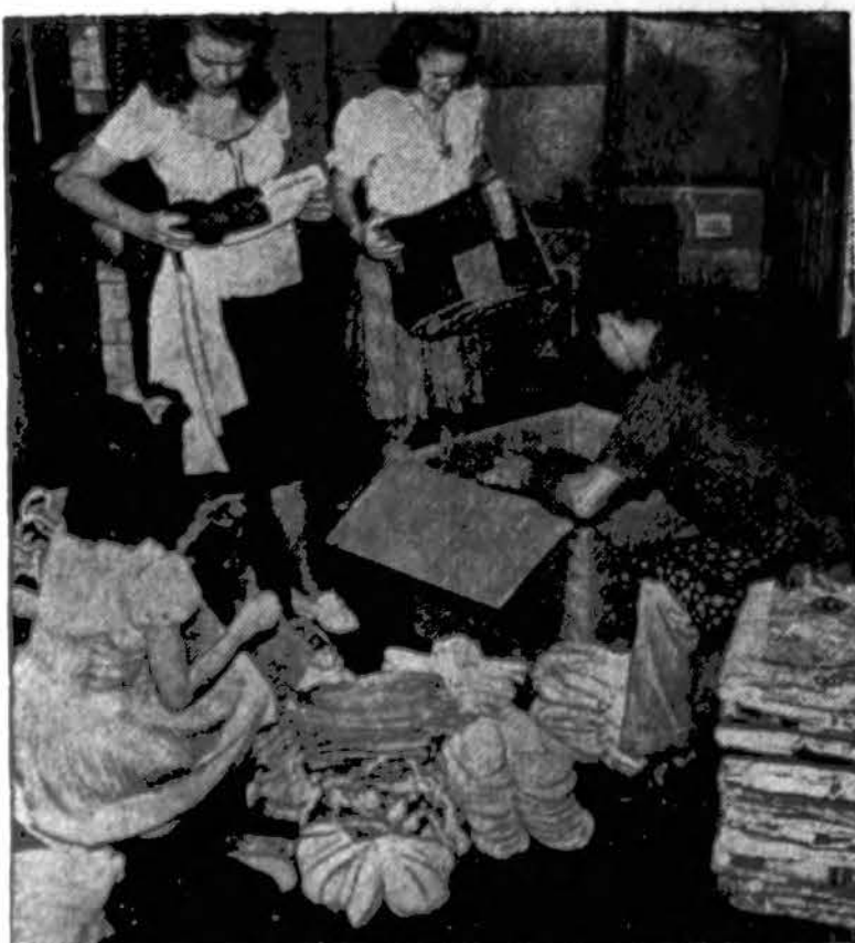
JUNIOR RED CROSS HELPS—Here members of the Junior Red Cross pack boxes of afghans, bed room slippers and games in the Red Cross Eastern Area storage depot, for shipment to military hospitals in the United States and abroad.