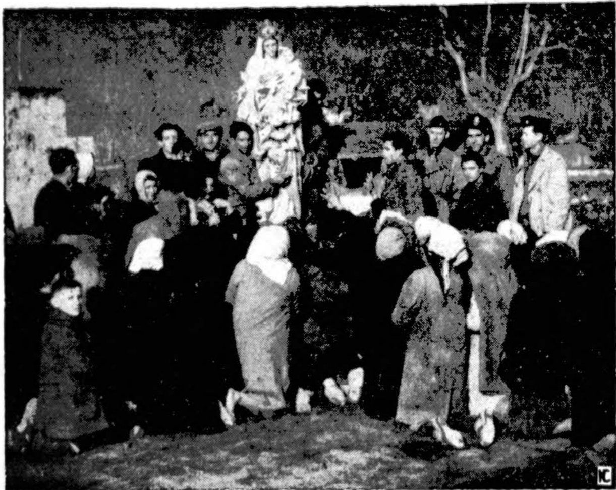
Netoli Napoli miesto, Italijoje, būrys žmonių suklaupusių prieš vežamą Amer. Raud. Kryžiaus automobiliu Panelės Sventčiausios statulą meldžia nuraminti galingą Vezu-vijaus veikimą. Kelias, ant kurio žmonės suklaupę, yra dešimčia colių padengtas cin-dromis, išmestomis iš vulkano kraterio. Dešinėj prie automobiliaus yra amerikiečiai Raud. Kryžiaus pareigūnai.

PARSIDUODA — 3 fletų mūro namas. Pirmas fletas karšto vandens šiluma, 2 karam garadžiū. Parsi-duoda už prieinamą kainą. Atsišau-kit vakarais po 5 val. kasdien iš-skiriant šeštadienį ir sekmadienį, sekandčiu adresu: 2352 S. OAKLEY AVE. Pirmam Aukšte. TAUPYKITE POPIERĄ KARO REIKALAMS PIRKITE KARO BONUS!