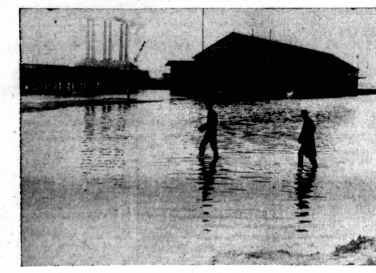
Didelei Mississippi upei patvinus, išėjęs iš vagos vanduo palietė net keturias vidur-vakarines valstybes. Vietomis vanduo vis dar kyla ir apsemia didesnius plotus. Ši nuotrauka iš St. Louis, Mo.