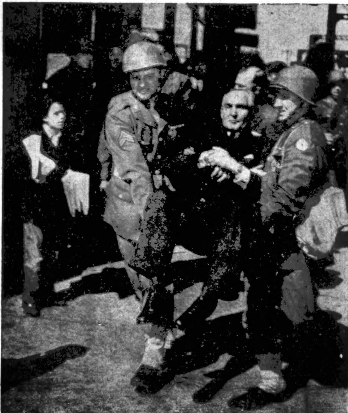
Sewell Avery, Montgomery Ward Company viršininkas, prievarta išnešamas iš krautuvės, kuomet atsisako padėti valdžios oficialams, kurie dabar valdo krautuvę. Kuomet U. S. prokuroras Biddle liepė Avery išeiti, o Avery atsisakė, buvo pašauti šie sargai, kurie jį nešė išnešė.