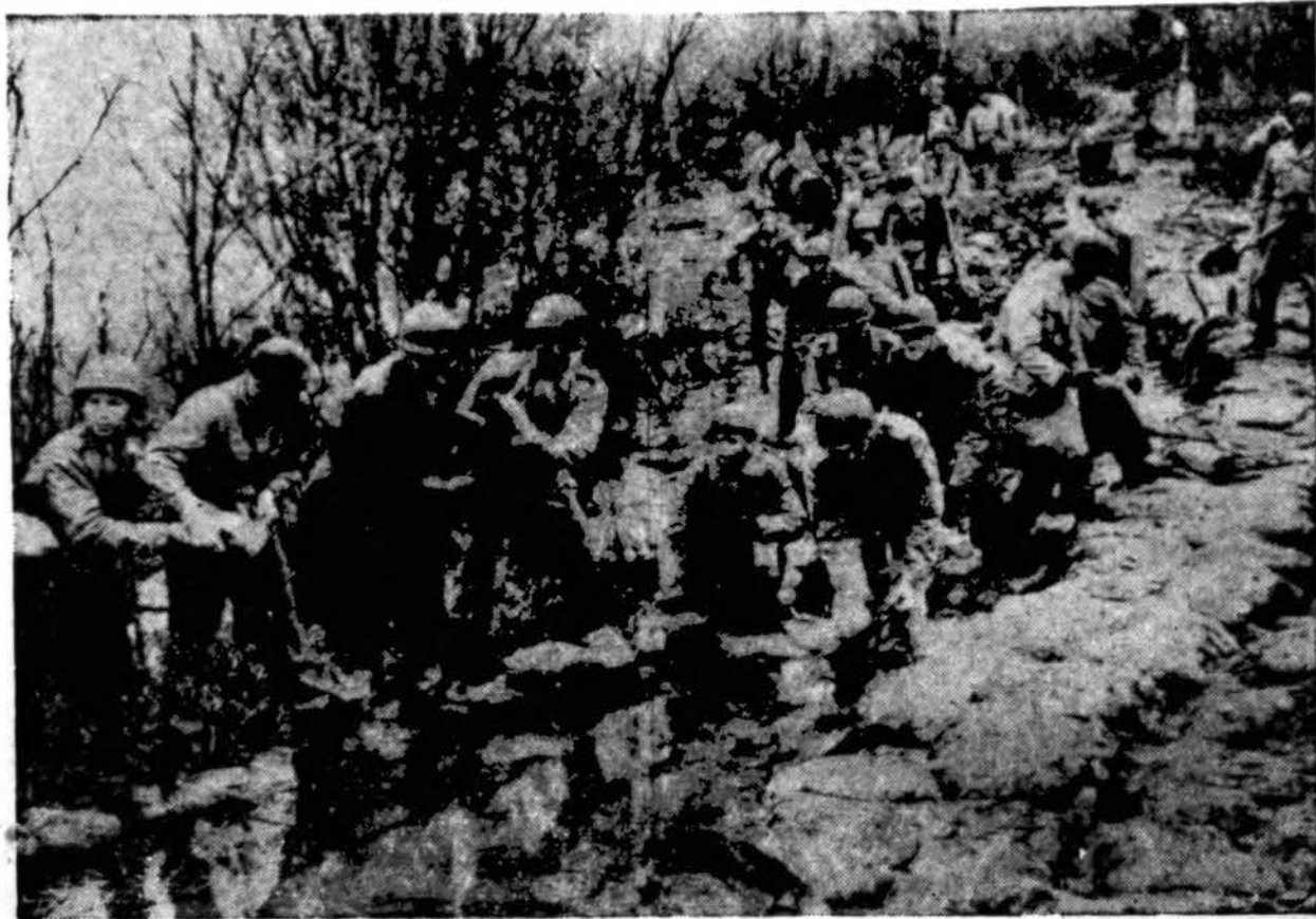
Kariuomenė iš Scott Field, Ill., pašaukta gelbėti gyventojus ir jų ūkio inventorių žemumose, kur milžiniškus plotus ir tūkstančius akierių dirbamosios žemės užliejo iškilus Mississippi upė.