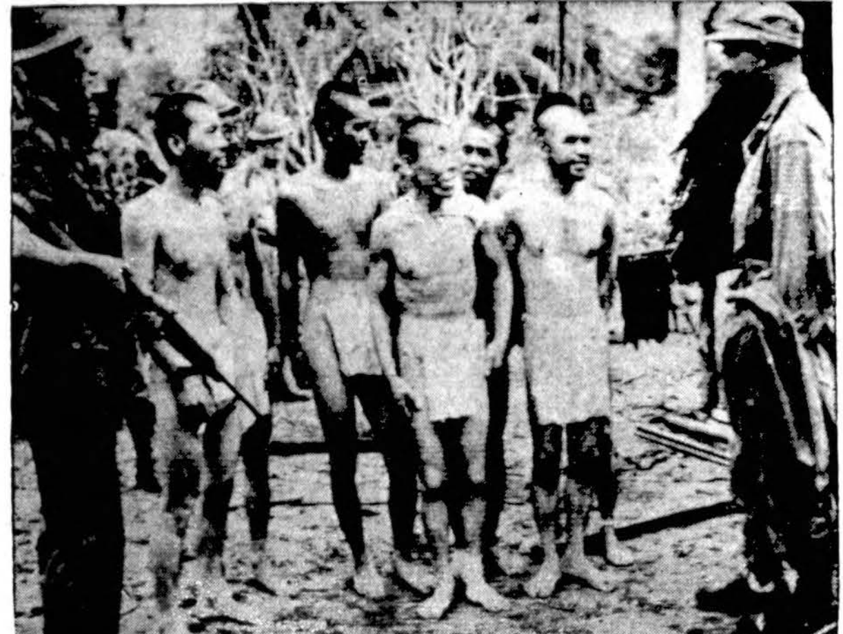
Vaidas iš tolimųjų Pacifiko salų, kur šiomis dienomis amerikiečiai ypatingai įsibuoja prieš japonus ir šluoja juos lauk. Čia matome grupę japonų, kurie pakliuvo nelaisvėn ir yra apklausinėjami.