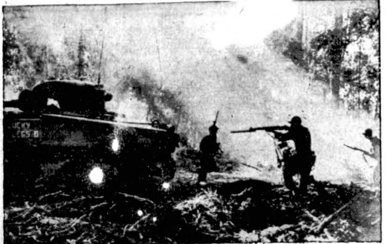
Amerikos kariuomenės kovų prieš japonus taktika. Kareiviai prisidengę slenkančių pirmyn tanku, nuolatos keičia pozicijas: tai lysdami iš vieno "lapės urvo" į kitą, tai pereidami į saugesnes vietas ir t. p.

baigė jo jūromis kelionės. 1616 m. baigė savo žemiškos kelionės vargus.