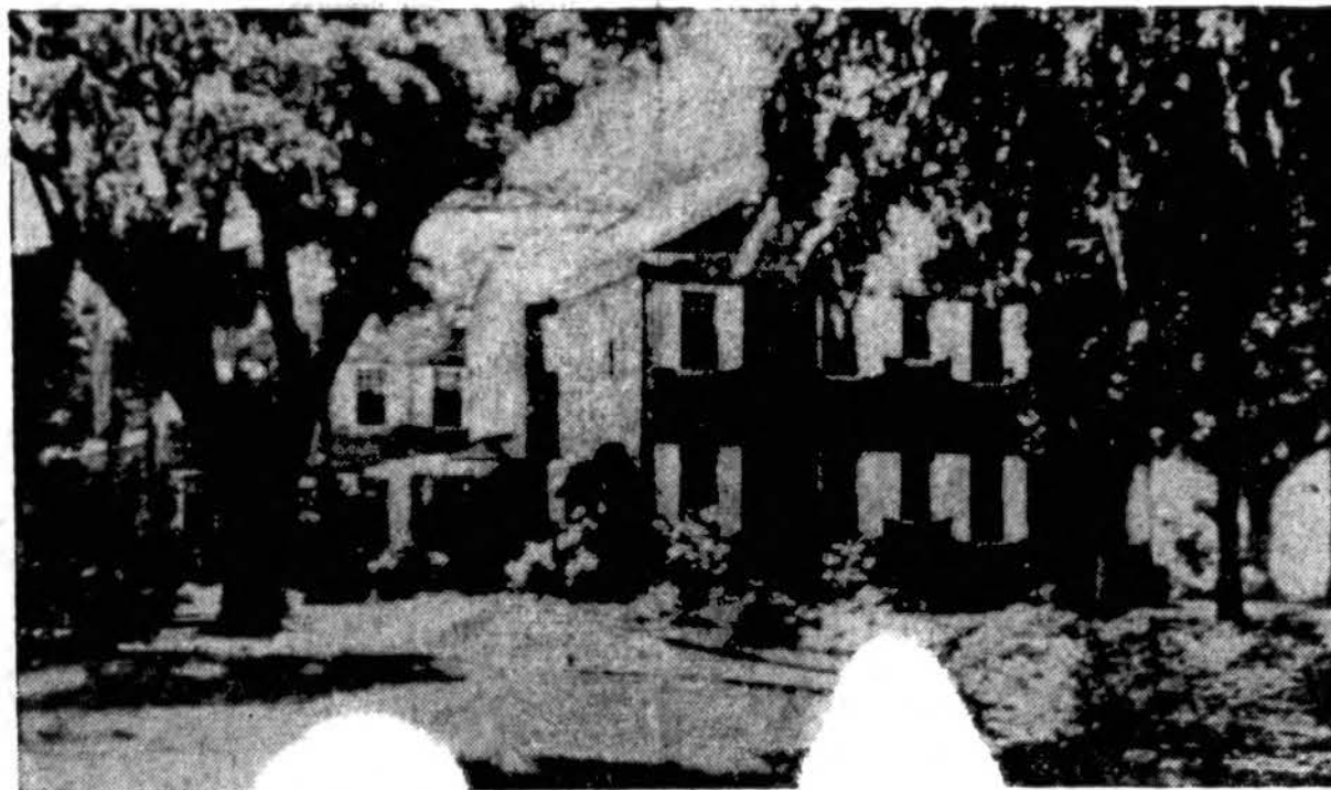
Bernard Baruch'o plantacija Hobcaw Barony, South Carolina valstybėje, kur Prezidentas Rooseveltas, jo asmeninis gydytojas Adm. McIntyre, ir Adm. Leahy praleido keturias savaites meškeriodami ir šiaip ilsėdamiesi. Užsienių reikalų sekretorius Hull laukė Prezidento Washingtone, ir tuoj patiekė jam kelias painias problemas.