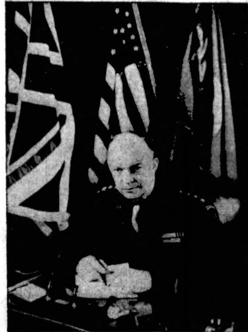
Gen. Dwight D. Eisenhower (mūšių uniformoj) savo generaliniame štabe kur nors Anglijoje, pasiruošęs dideliu ir lemiamam žygiui.