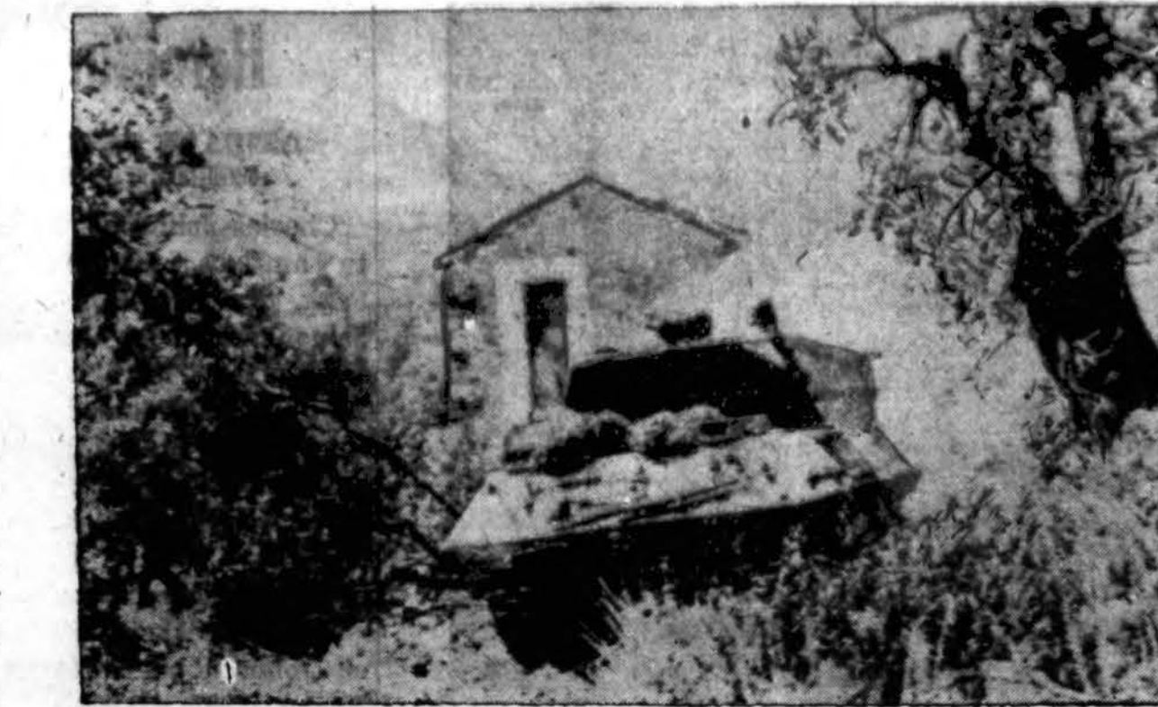
Prancūzų Morokos tankų-naikintuvų vienetas sėkmingai atlieka vokiečių lizdų naikinimą Castelforte rajone, Italijoje. Visam Italijos fronte eina sąjungininkų ofensyva.

Camp Grant, kurie buvo siunčiami į ūkius padėti daržovių surinkime, vaikštinėja sau ir duoda daržovėms supūti.