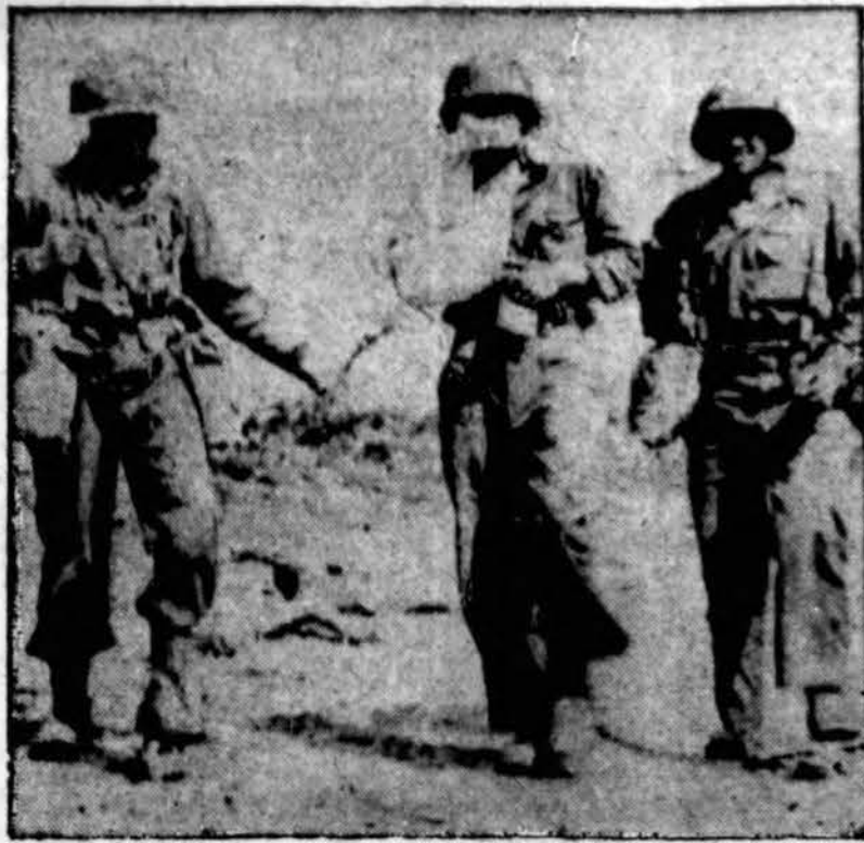
Amerikietis kareivis, sužeistas Santa Maria kovoje, yra lydimas iš miesto dviejų "medikų".