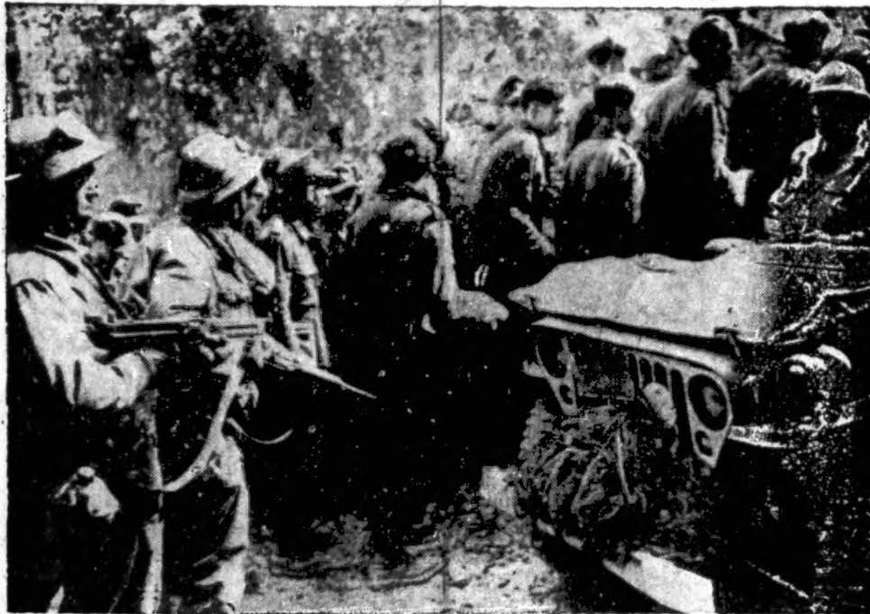
Du Amerikos aprūpinti prancūzai kariai (kairėje) saugo priešo karius Castelforte, Italijoje. Naciai buvo suimti antroje aliantų ofensyvos dienoje.