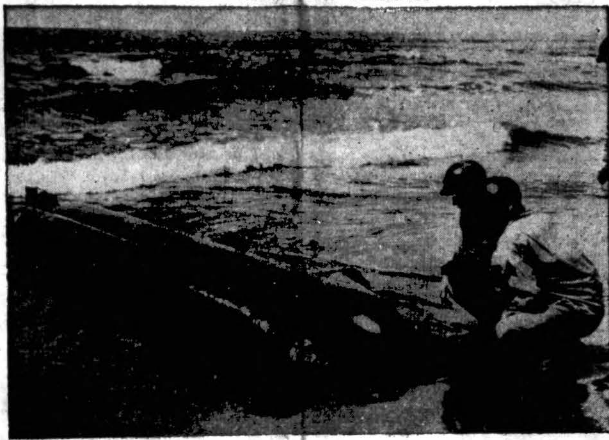
Amerikiečiai kariai apžiūri vieno vyro vairuojamą submariną Anzio krante. Submarino vairuotojas, 17 metų naciis, buvo suimtas. Kairėje matosi torpeda, o didesnė dalis yra „submarinas“. Torpeda taip prijungta, kad ją galima paleisti, o vairuotojas gali tuomet pabėgti.