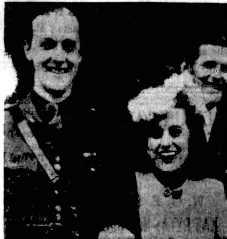
Kathleen Kennedy, buv. Amerikos ambasadoriaus Did. Markizo iš Hartington po šūbuo Londone. Kairėje jaunosios broliis Lt. Joe Kennedy. Britanijai duktė, nusifotografavus su Devonshire grafu