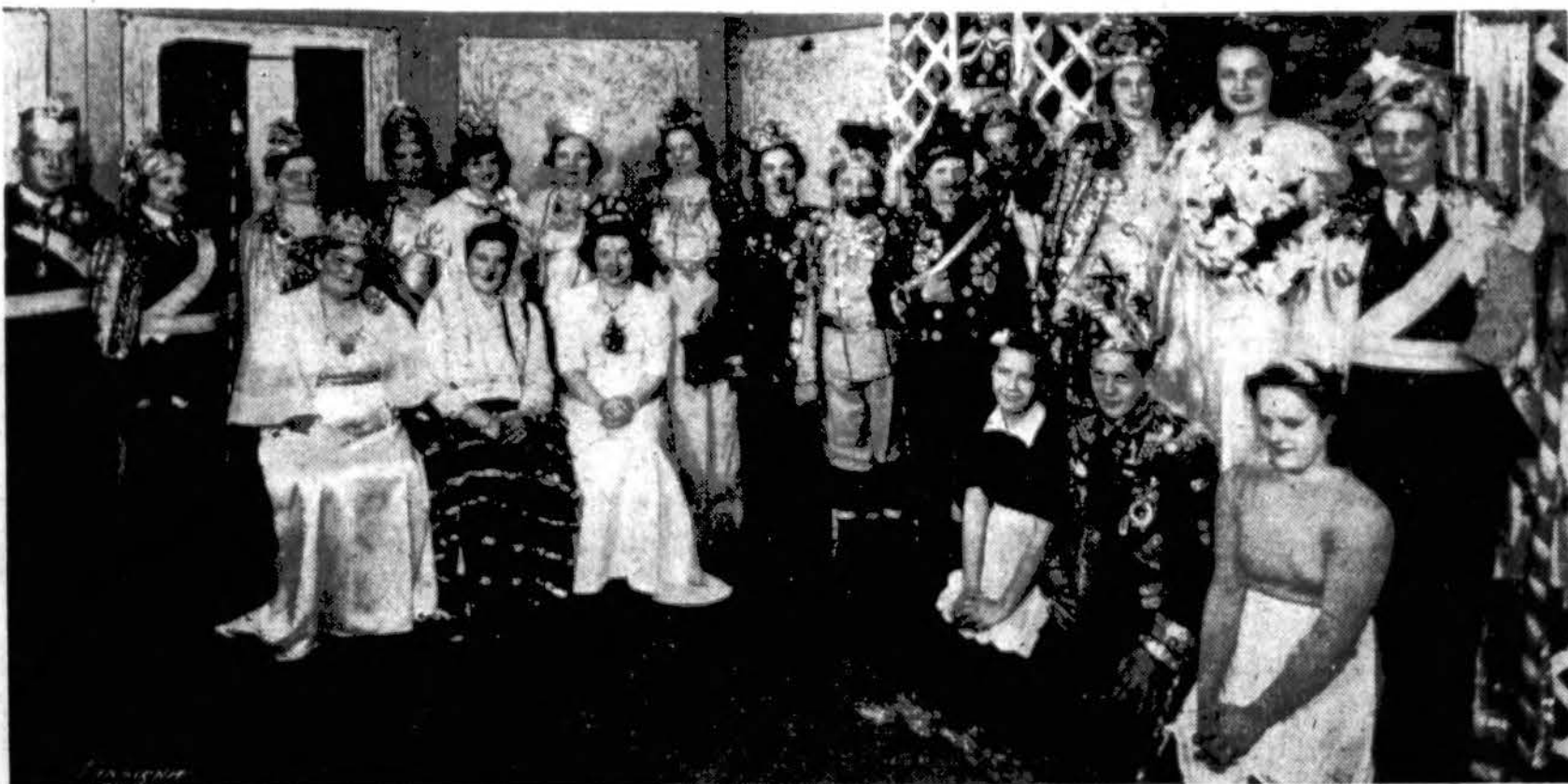
ROZIŲ IR LELIŲ KLIUBAS PERSTATYS SPECIALIAI PARUOSTĄ DIENOS PROGRAMĄ

Aštuonioliktiečiai kaip paprastai yra pasižymėję idomių piknikų rengėjai. Taigi ir šiame, sako būsiąs tikrai idomus ir linksmas parapijos piknikas, nes jie turį prirengę specialų programą, kuris tikrai visus linksmins ir žavės. Be specialaus programo bus šokiai, žaidimai ir kiti įvairumai.