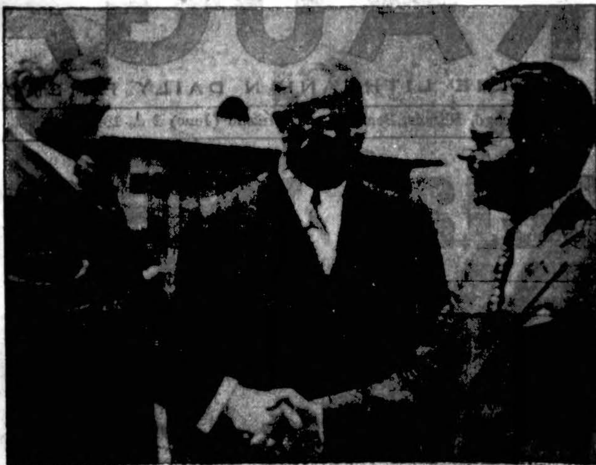
Trys respublikonų partijos vadai: Ohio val. gubernatorius John W. Bricker (kairėje), California val. gubernatorius Earl Warren ir New York val. gubernatorius Thomas Dewey. Visi trys yra stiprūs kandidatai į būsimus prezidentus iš respublikonų partijos.

Kiekvienas žmogus, norinori, turi mirti. Jo kūnas turi grįžti į žemę, siela — nemirtingųjų tvarinių karaliją. Žmogaus siela yra atskira, nesuardoma substancija galinti gyventi ir be kūno; ji yra skirta amžinybei. Apie žmogaus sielos nemirtingumą Chataubriandas sako: "Gyvulys nepažįsta kapo, jis nesirūpina tėvų peilenais. Tik žmogus terenka