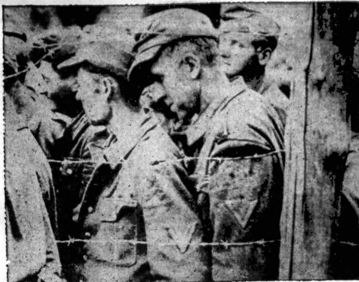
Amerikos Penktosios Armijos vieneto, kurį sudaro prancūzai kariai, paimti į nelaisvę vokiečiai įgyjuoja į prancūzų įsteigtą stovyklą belaisviams. Įdomu: vokiečiai yra okupavę Prancūziją, o Italijoje vokiečiai yra prancūzų nelaisvė.