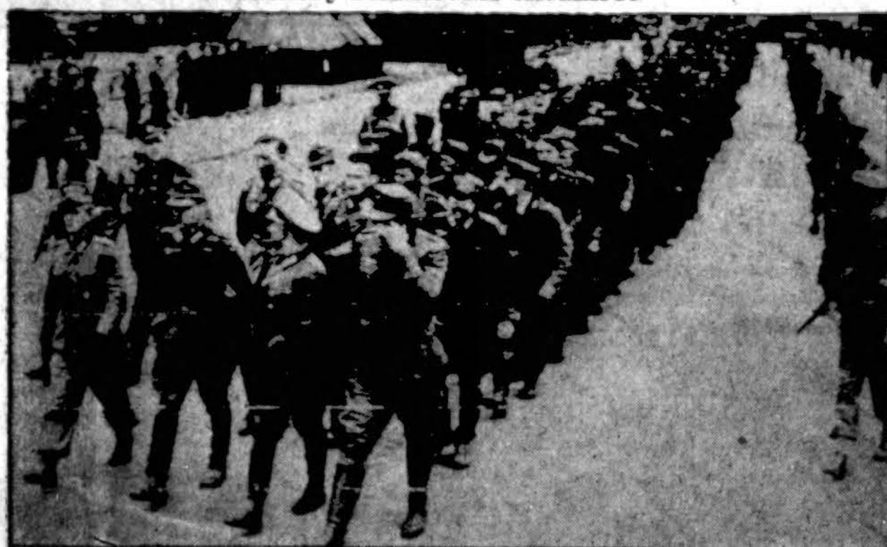
Iš Prancūzijos pargabenti Anglijon pirmieji vokiečių karo belaisviai maršuoja į koncentracijos stovyklą.