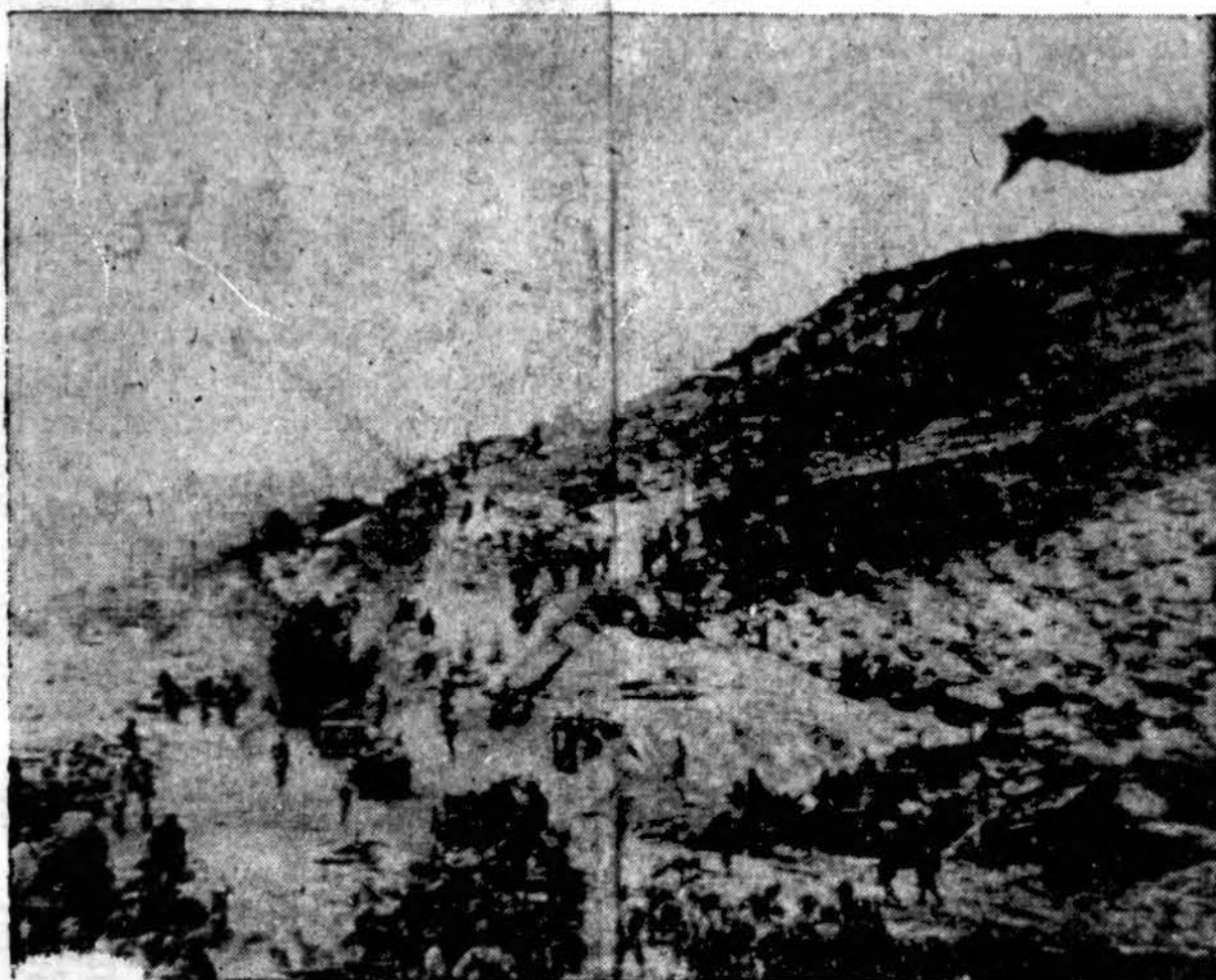
Bendras vaizdas kranto pozicijos kur norint Normandijoje, kuriame matosi amerikiečių kariai ir jų į pakalnę vežamos reikmenys. Virš jų skraido sąjungininkų balionas, kuris stebi priešo sąstus.