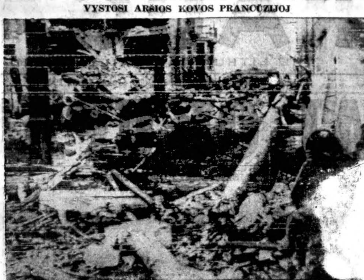
Vaizdai liūdią apie vystymąsi aršių kovų Prancūzijoje. Šioj nuotraukoj vienas Normandijos bažnytkaimis labai nukentėjęs nuo britų puolimo, o vokiečių gynimosi.

Tai didelės ir gražios New Yorko valstijos lietuvių pastangos, prisidedant prie karo laimėjimo! Ačiū visiems už tai! Laikė dabar pravedamos Penktosios Karo Paskolos vėjus mes kviečiame visus New Yorko miesto ir valstijos lietuvius pasirodyti dar geriau, kad už mūsų karo bonais sukeltus pinigus ga-