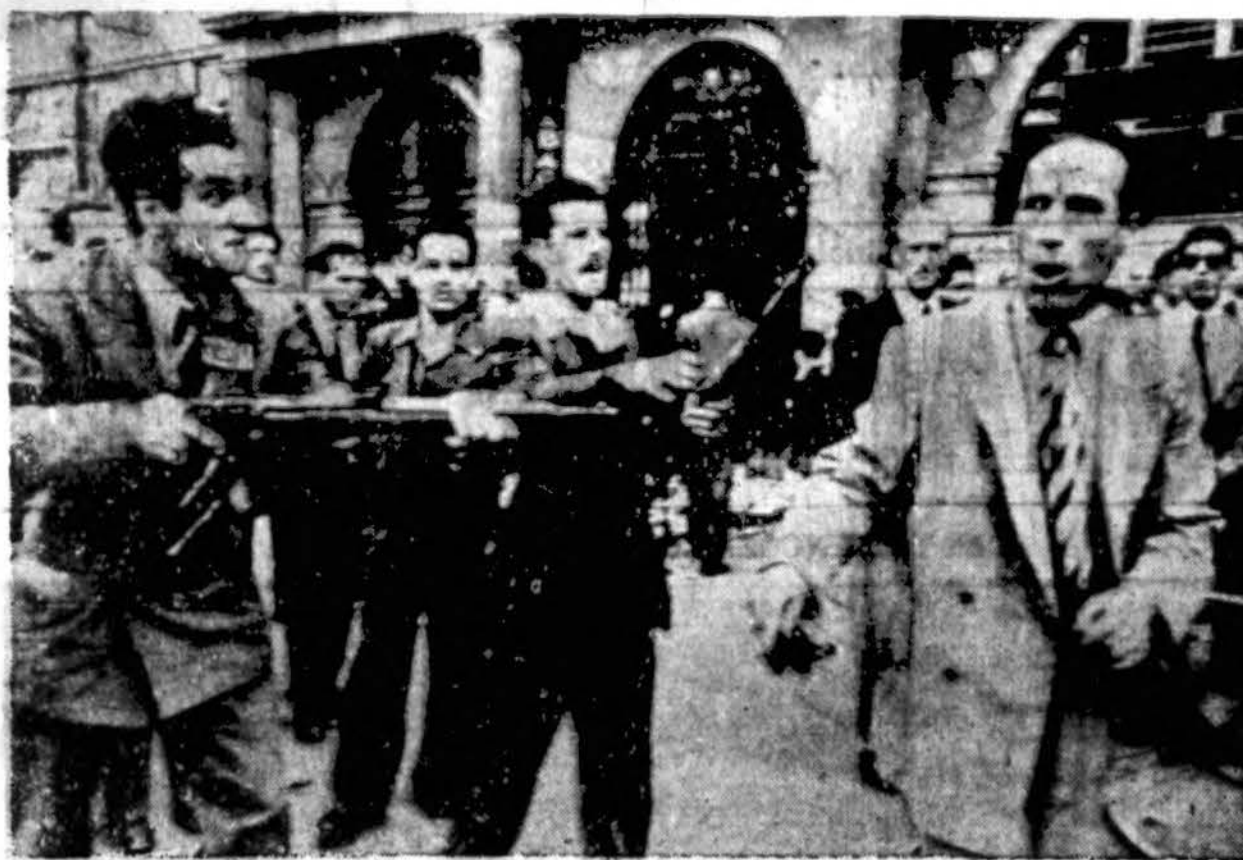
Sajungininkams užėmus Romą, ant-fašistai pradėjo gaudyti visus neišbėgusius fašistus, uolius Mussolinio laikotarpio režimo vykdytojus. Šioj nuotraukoj suimta vienas fašistą įtuzusi minia kolioja.