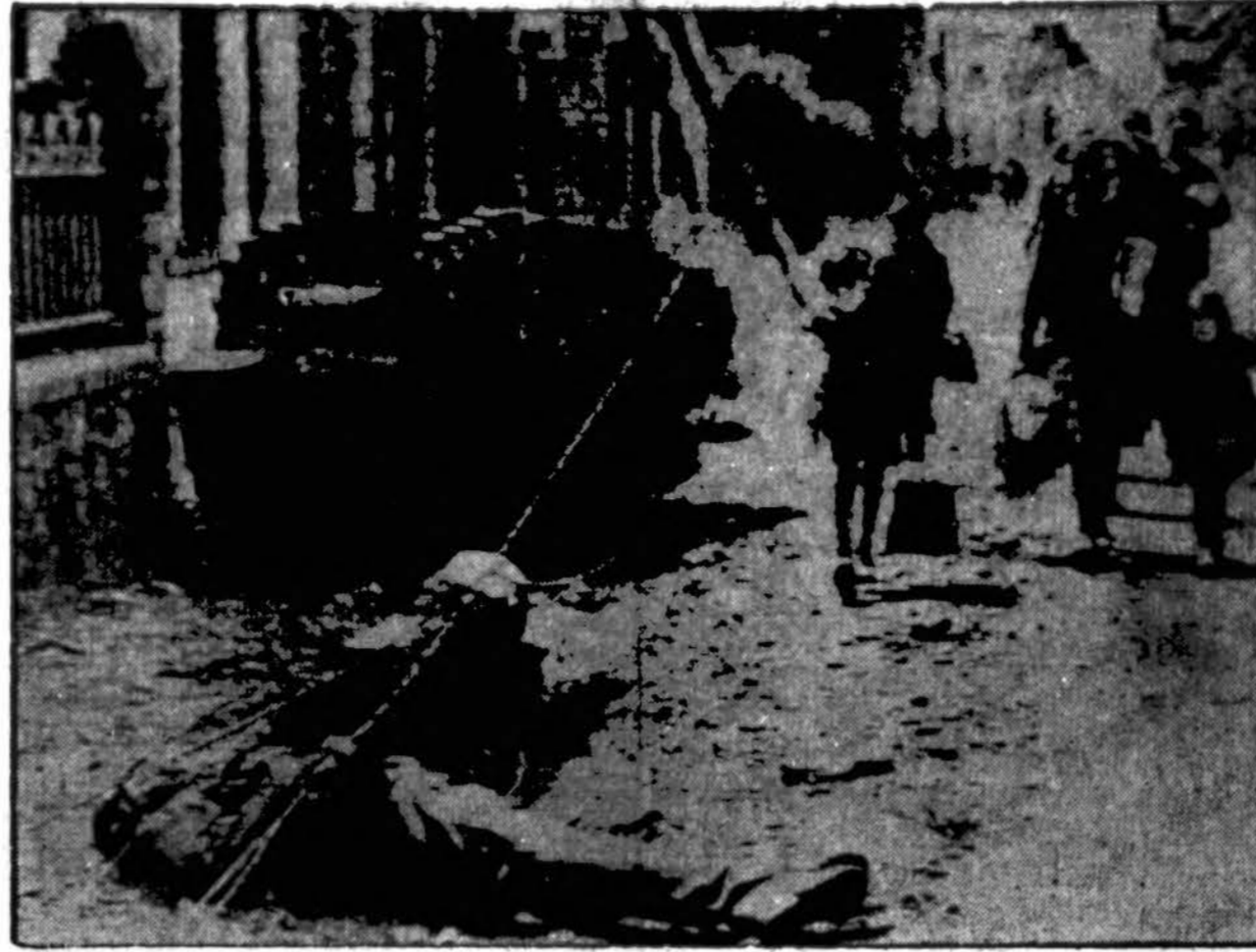
Civiliai prancūzai grįžta į savo namus išlaisvintame Prancūzijos mieste, ir nerodo susidomėjimu išmuštu nacių tanku nei žuvusiu vokiečiu.