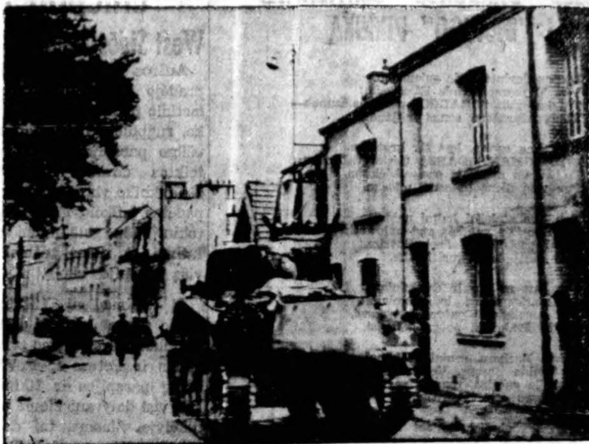
Amerikos tankai ritasi Cherburgo gatvėmis baigdami likviduoti užsilikusius nacių liudius. Išlaisvinti gyventojai visur amerikiečiams kelia didžiausias ovacijas.