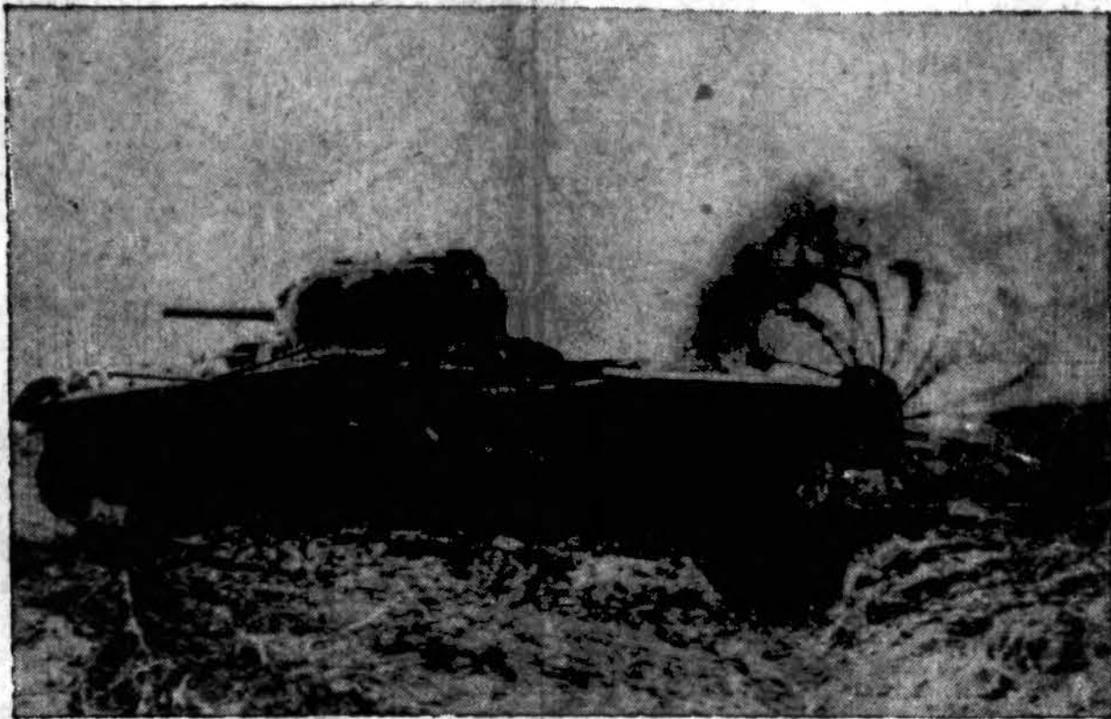
Sis naujoviškas britų tankas, vadinamas “Scorpion”, turi priešakyje įtaisytas grandines, kurios plaka žemę ir išsprogina nacių paslėptas minas. Šitokie tankai atlieka ypatingą rolę tankų grumtynėse, kurios dabar vyksta aplink Caen.