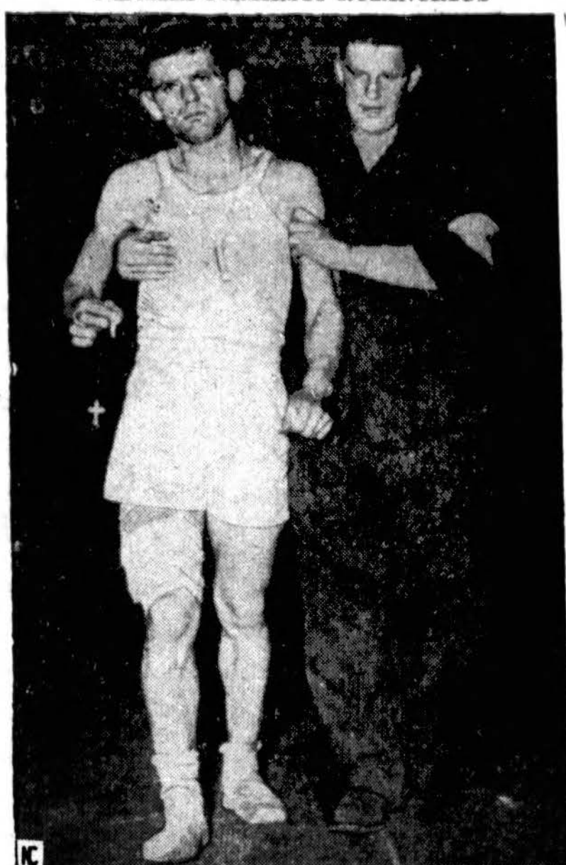
Vienas Amerikos karių, kad ir apsvaigęs nuo sužeidimo Prancūzijoje, padedamas Raud. Kryžiaus pareigūno, įsėsti į transportą, kad perkėlus į karo ligoninę Anglijoje, dešinėje laiko cigaretę ir rožančių.