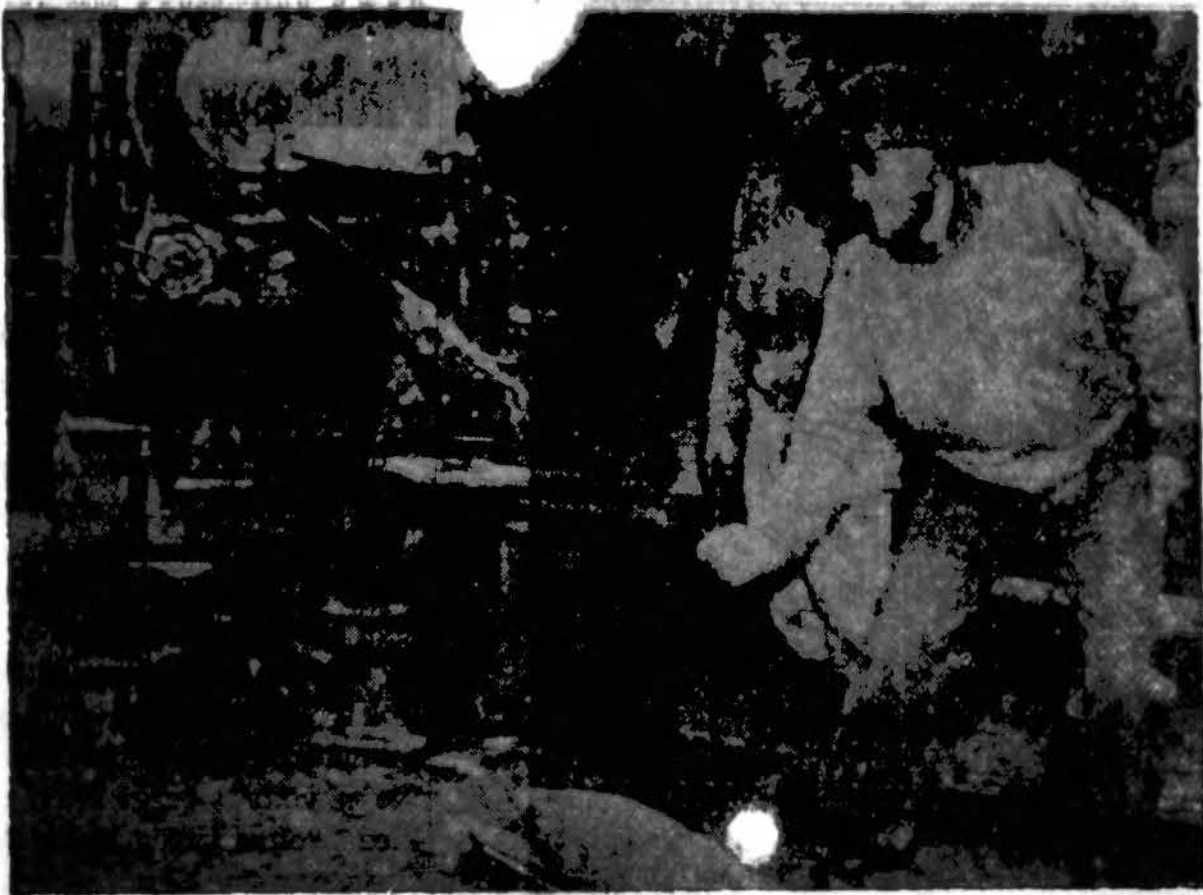
Amerikos Jungtinių Valstybių nepriklausomybės sukakčiai paminėti, generolas Omar Bradley liepos 4-tą dieną, 12 valandą, išsaauna "Long Tom", tai yra vieną didžiųjų Amerikos kariuomenės Prancūzijoje kanu olių.

konferencijos nutarimu; suimtinėjamos ir kalinamos nesiregistravusių karininkų šeimos ir naujokų tėvai Kubiliūno įsakymu. Visur vokiečiai stengiasi sudaryti išspūdį, kad tai pačių lietuvių darbas ir reikalas.