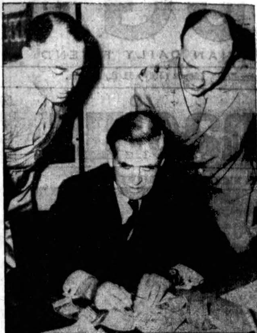
Amerikos Jungt. Valstybių vice prezidentas Henry A. Wallace sugrįžęs namo iš Kinijos. Seattle, Wash., jį pasitinka karininkai.