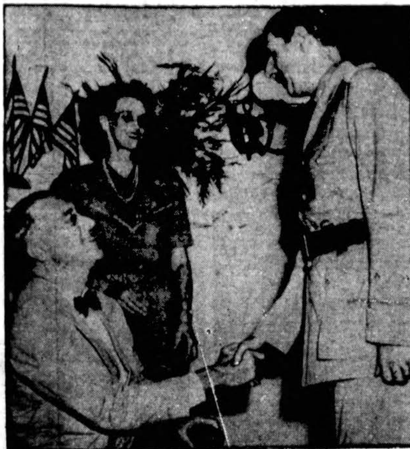
Gen. Charles De Gaulle, kurs šiuo metu vieši Amerikoje, priimamas audiencijon mūsų prezidento. Centre prezidento dukte Mrs. John Boettiger.