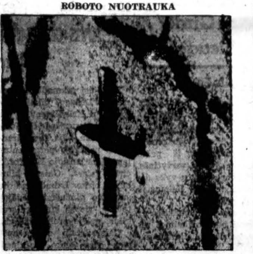
Roboto nuotrauka. Nacių robotinis lėktuvas-bombo, kurios iš okupuotosios Prancūzijos leidžiamos į Angliją, nufotografuota ore. Nuotrauka padaryta iš Amerikos karo lėktuvo, kuriais daug tų bombų būna sunaikintos ore, nepasiekus nustatytos distancijos.