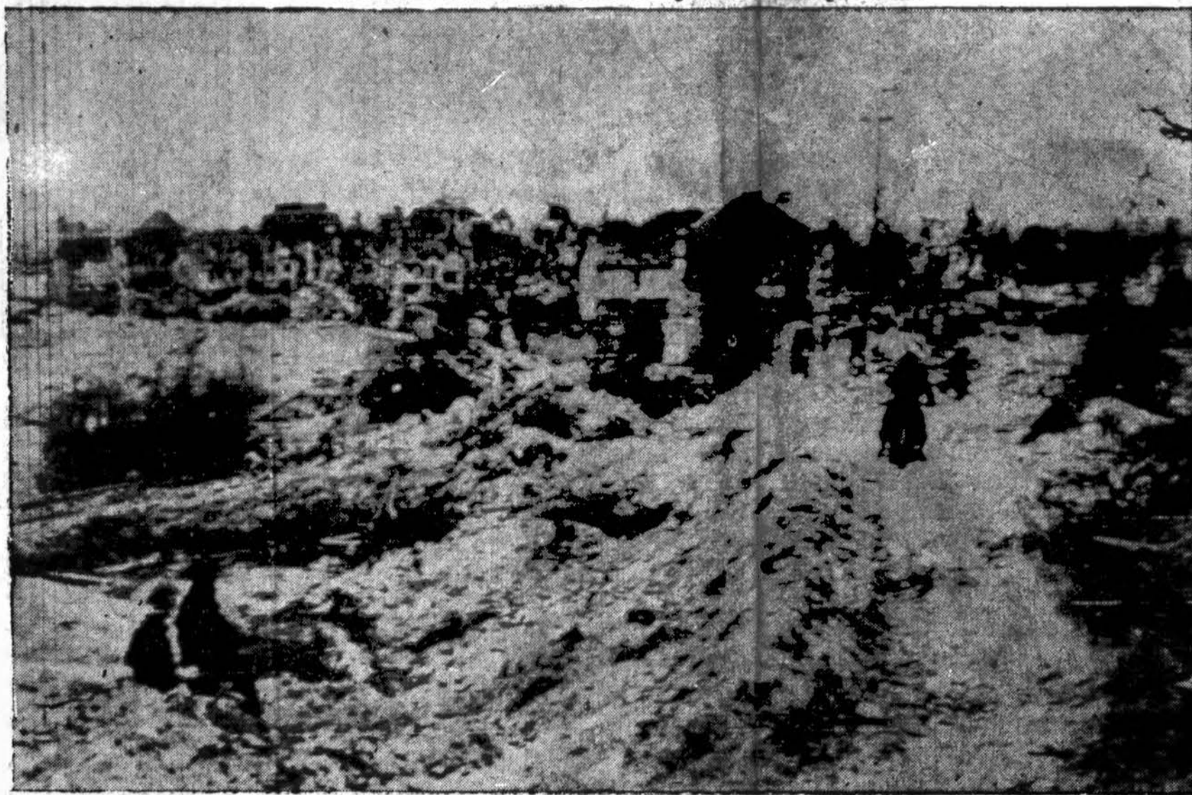
Britų antrai armijai uždaranč duris ant vokiečių, kurie tebestovi anapus Orne upės, užimto Caen pietiniuose priemiesčiuose, užimta eilė Normandijos miestelių ir tvirtovių. Čia matoma kaip britai ant motociklų važiuoja išaizytu keliu į Caen'ą. Caen'o Orne kanalo susijungimas su jūra rastas beveik nepaliestas.