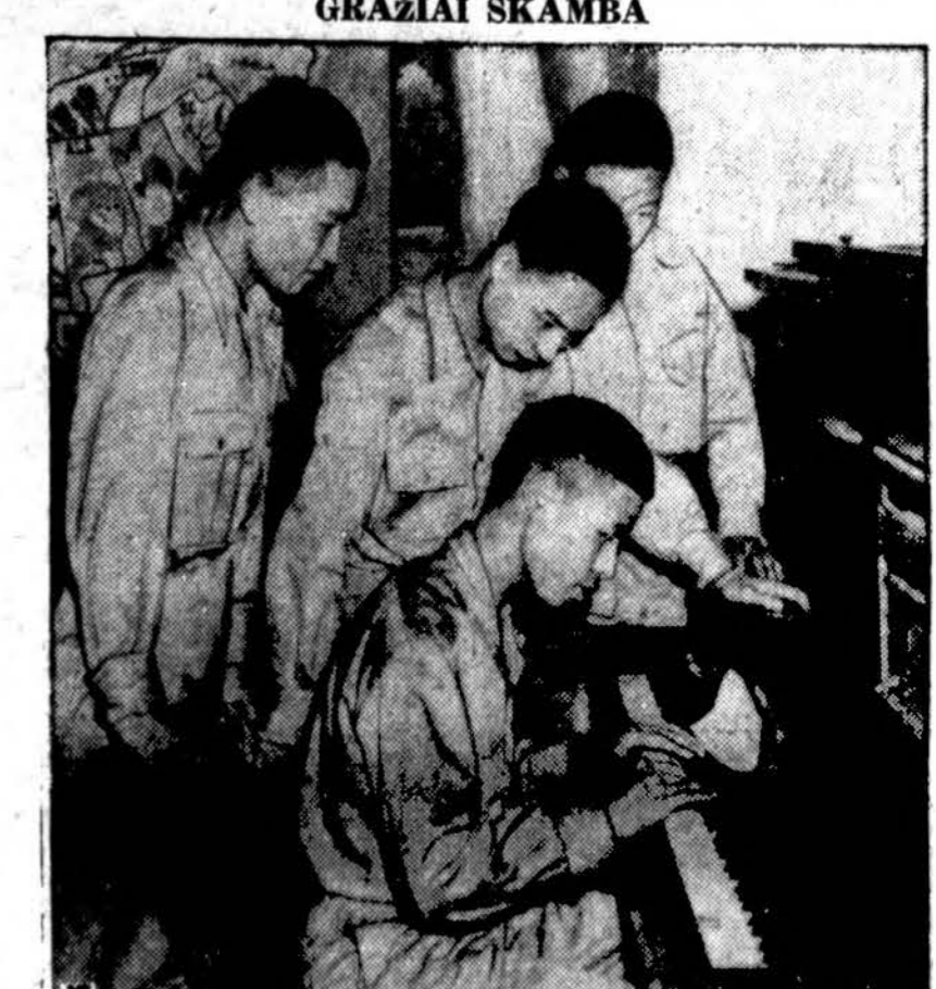
Keturi Kinijos karo lakūnai, pakeliui į lakūnų mokyklą, sustoję New Orleans, La., katalikų (NCCS) išlaikomam USO klube išbando pianą. Iš reiškiamo susidomėjimo atrodo, kad tas įrankis jiems yra didelė naujiena.