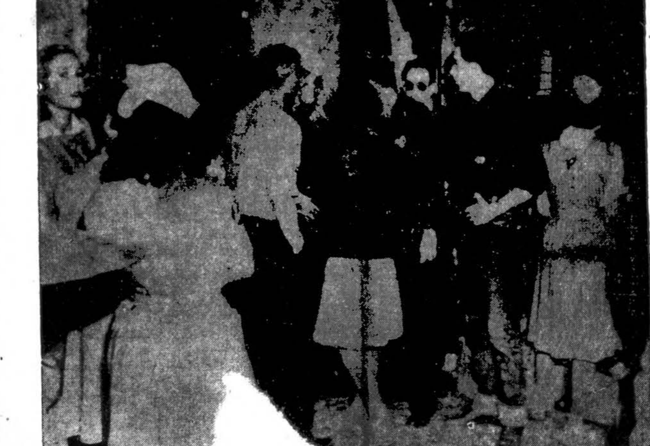
SIMTAI UZMUSTA IR SUZEISTA LAIVYNO STOTY

Žemę drebinantis sproginimas laivyno amunicijos stotyje, Port Chicago, California, užmušė bent 350 vyrų ir kelis šimtus sužeidė. Laivyno pranešimas sakė tik keturi lavonai buvo rasti, o kiti žuvę vyrai buvo sudraskyti į šmotelius. Atvaizde matoma kaip sužeistiesiems duodama pirmoji pagalba.