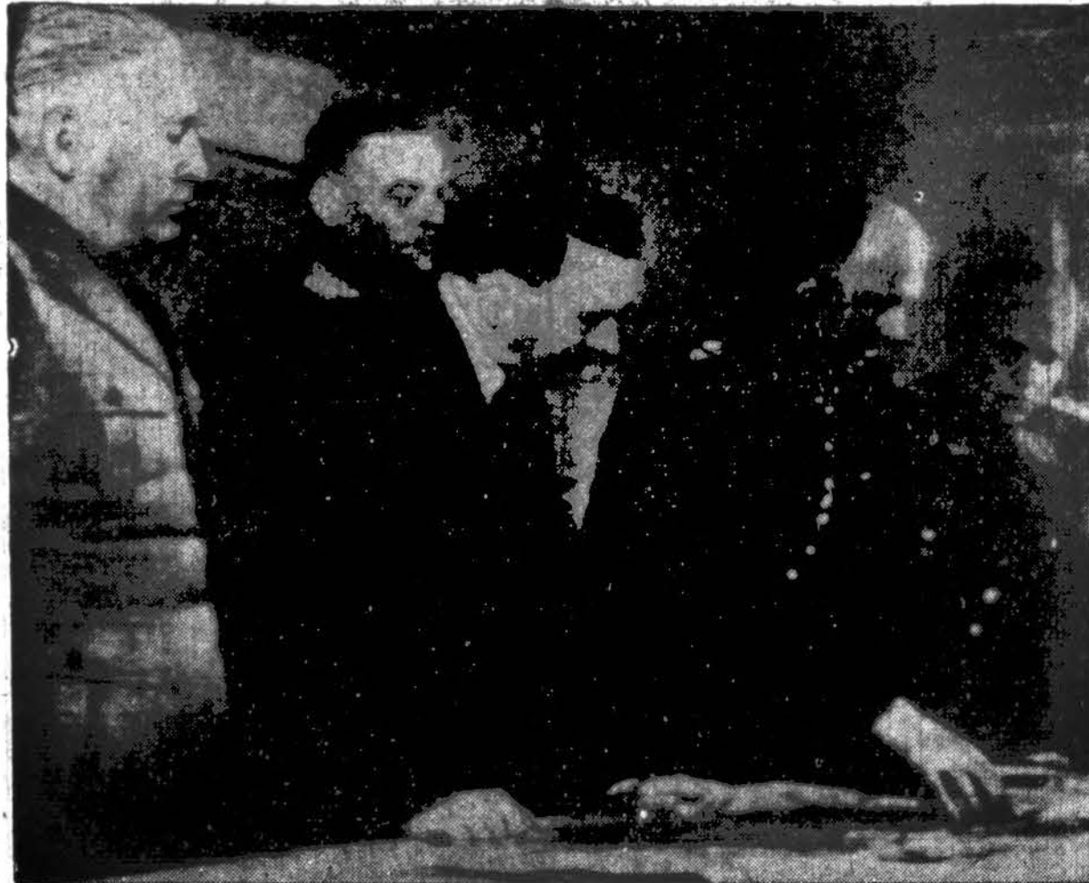
Adolfas Hitleris buvo tik apdegintas ir užgautas, kuomet buvo padarytas pasikėsinimas ant jo gyvybės. Nutraukta štabo konferencija panaši į čia atvaizduotą, kurioje Hitleris (centre, priešaky) tariasi su savo štabo viršininku, Gen. Alfred Jodl (antras iš dešinės), kuris buvo nesunkiai sužeistas. Po atakos, anot Berlyno radio, Hitleris priėmė Benito Mussolini.