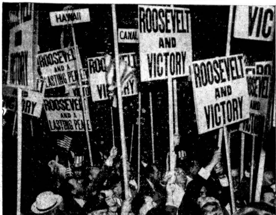
Nuotrauka padaryta tuo metu, kai viena dalis Texas delegacijos konvencijoje sukėlė demonstraciją nominavus prez. Rooseveltą. Kita dalis Texas delegacijos rėmė Byrdo kandidatūrą.