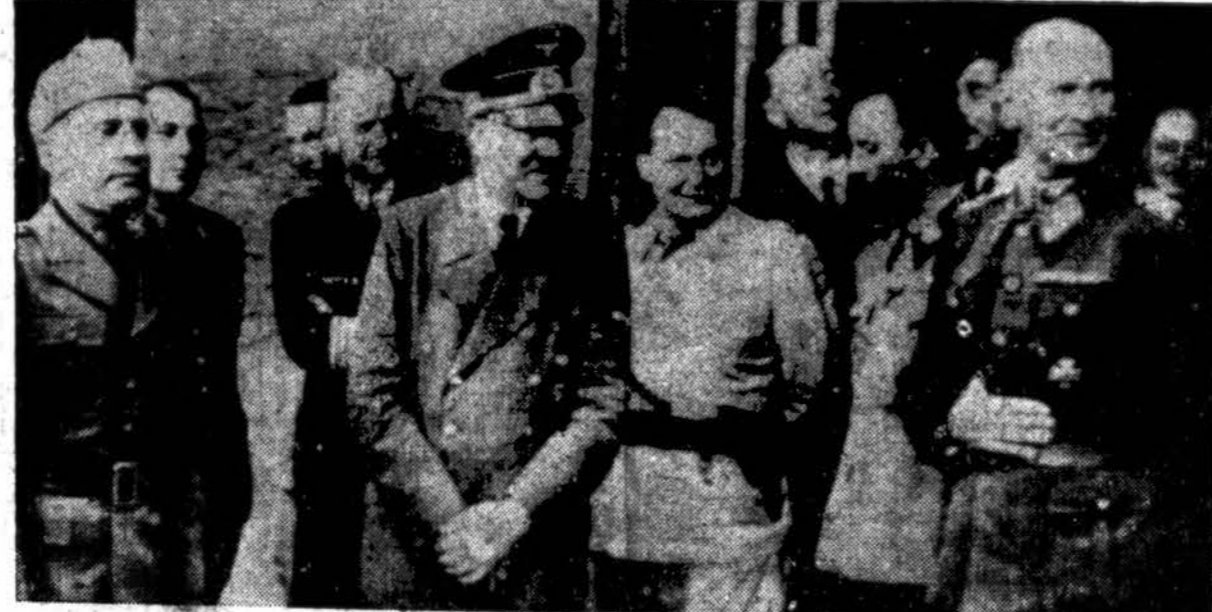
Užrašas ant šios nuotraukos, atsiųstas per radio iš Stokholmo, sakė ji buvo padaryta po pasikešimo ant Hitlerio gyvybės. Joje matosi nacių fiureris (centre, su užrišta ranka), Mussolini (kairėje), Goering ir Adm. Doenitz.